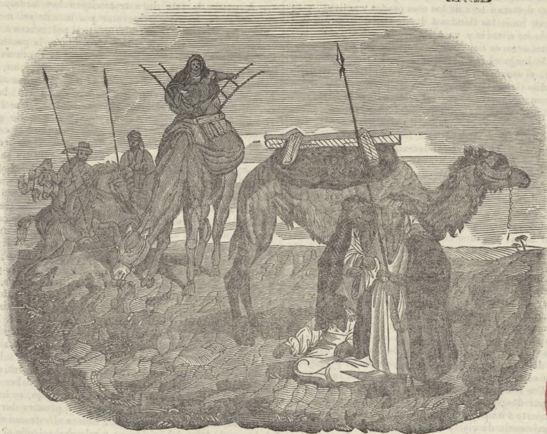
LOS ÁRABES BEDUINOS.