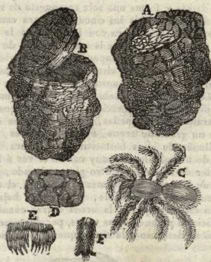
(Nido de la araña Mygale Coementaria .)

Diferentes especies de arañas construyen una tela cilíndrica ó celda debajo de tierra con su tapa fija por medio de una especie de gozne, y la cual puede el insecto abrir y cerrar á voluntad. Una de estas arañas ( Mygale Coementaria ) comun en varios puntos de nuestra península, escoge para fijar su residencia un sitio libre de yerba, un poco inclinado para que corran las aguas, y de un suelo firme sin rocas ni piedras. Abre una galería de uno ó dos pies de profundidad igual en toda su estension y bastante ancha para poder ella salir y entrar con desahogo.