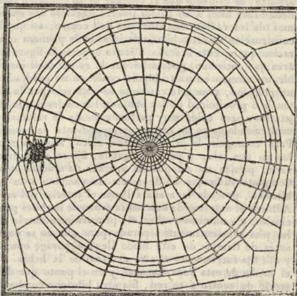
(Red geométrica de la araña de campo.)

La araña tejedora que sin convite se establece en la habitacion del hombre, procede en la construccion de su tela del modo siguiente. Despues de elejir el rincon que le parece mas á propósito, aplica sus ubres á una de las paredes, dejando de este modo pegado á ella uno de los extremos de su hilo. Camina entonces por la pared, y situándose en el lado opuesto fija allí el otro extremo. Como este hilo ha de servir de margen ú orilla á la tela y necesita por consiguiente ser fuerte, cuida la araña de hacerlo triple ó cuádruple con solo repetir la operacion in-