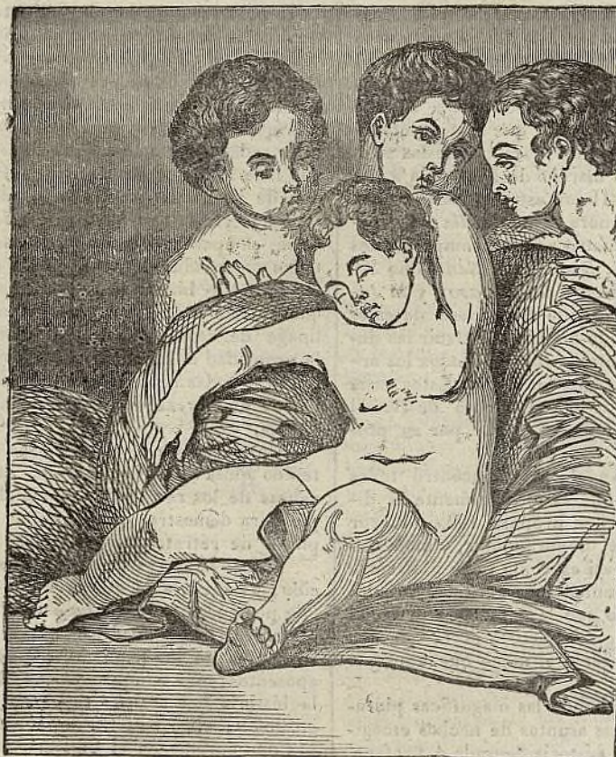
(El sueño del niño Jesús.)

R AFael SANZIO nació en Urbino en 1483, y murió en Roma á 7 de abril de 1520, día de Viernes Santo que había sido también el de su nacimiento; de suerte que solo vivió treinta y siete años, y sin embargo es el mas grande, y uno de los mas fecundos, entre los pintores modernos. Pues esta reputacion tan ruidosa y universal, que nada podrá menoscabar, la adquirió Rafael durante su vida, en la época mas brillante de la pintura, entonces cuando Leonardo de Vinci y Miguel-Ángel Buonarrotti habían elevado el arte al mas alto grado de gloria, y cuando además del mismo Rafael florecían el Corregio, el Giorgione, el Ticiano y los artistas mas famosos de la escuela veneciana.