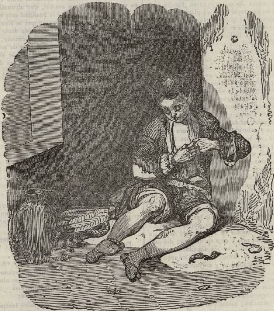
(El joven mendigo.)