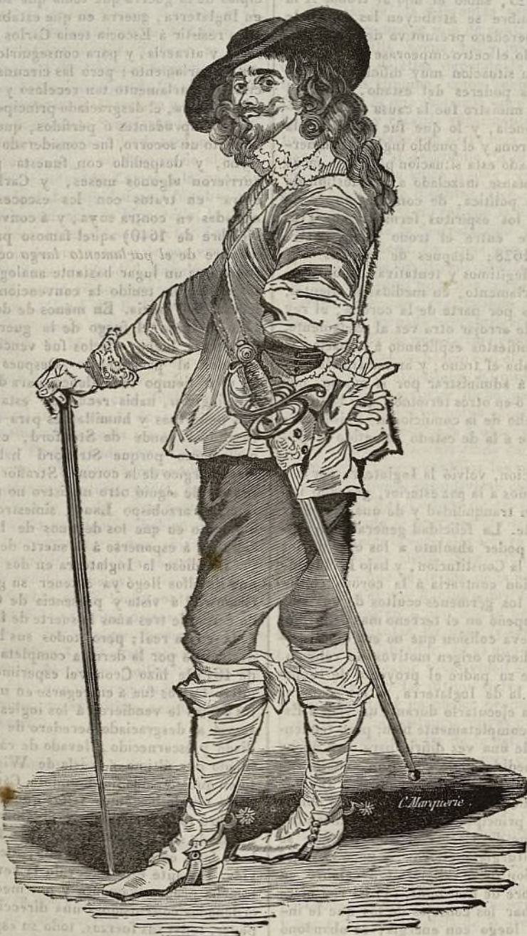
Carlos I de Inglaterra.