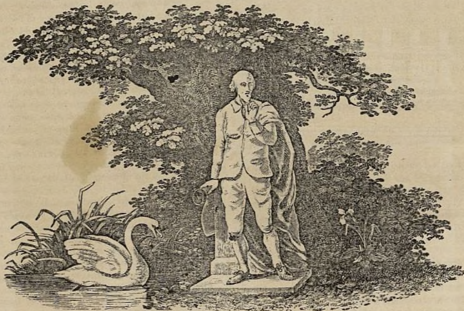
(Monumento elevado á Shakspeare.)