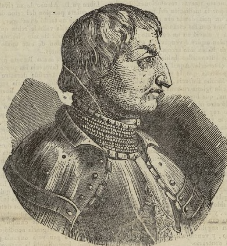
DON ALONSO V.º DE ARAGON.

D on Alonso V fue uno de los reyes mas grandes que ilustraron á Aragon. Era hijo de D. Fernando el Honesto, infante de Castilla, y elevado á aquel trono por la junta de compromisarios que se reunió en Caspe para elegir entre los varios competidores que aspiraban á la sucesion del rey D. Martin el Ceremonioso. D. Alonso, pues, y sus hermanos habian nacido en Castilla; y como estos tenian en ella cuantiosos bienes y elevadas dignidades, no contribuyeron poco á las continuas revueltas que agitaron el turbulento reinado de D. Juan II.