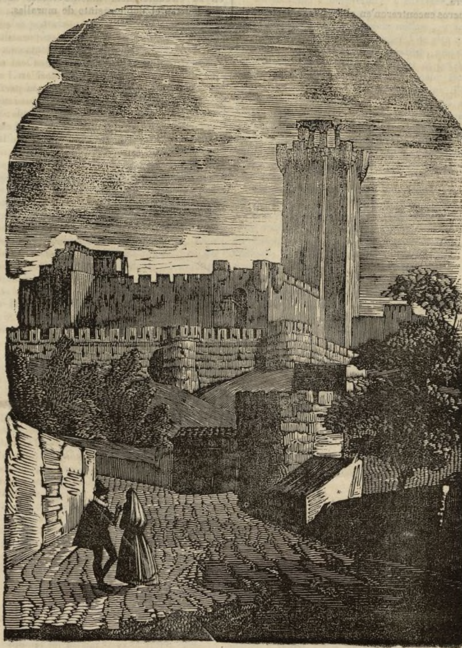
EL CASTILLO DE LA MOTA.

E l castillo de la Mota fue una de las mas célebres fortalezas en Castilla. Fernando de Carreño , llamado en las crónicas obrero mayor , lo construyó por los años de 1440 reinando D. Juan el II. Está ventajosamente situado sobre un montecillo al norte de la antiguamente rica y populosa villa de Medina del Campo. En medio del abandono en que yace de muchos años á esta parte, aun presenta un aspecto grandioso é imponente, y recuerda al viajero los muchos y singulares acontecimientos de que ha sido teatro. Su plaza de armas es muy espaciosa, y la TOMO III.—Trimestre II.