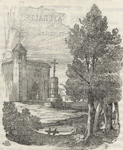
La Urraca—La Rama—El Tronco—La Tierra y el Sol.