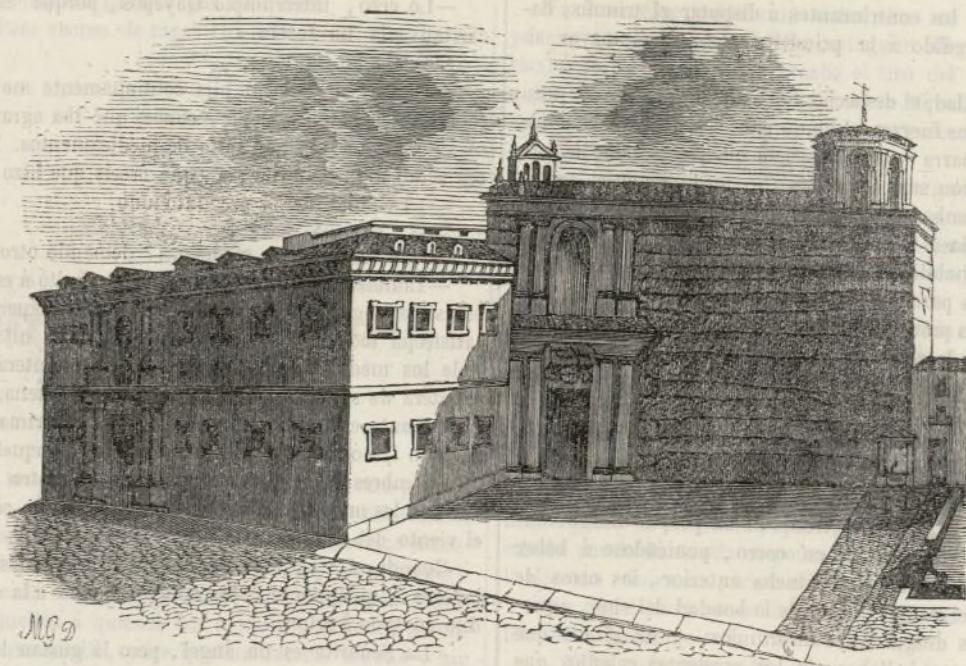
Hospicio de Vitoria.

Animados de un noble orgullo, reconocemos los monumentos que salvándose afortunadamente de las guerras y vicisitudes políticas, no menos que del trascurso de los tiempos, permanecen para gloria de los artistas que en su construccion se ocuparon, de los personajes que los erigieron, y de la nacion que á unos y á otros vió nacer. Y en tanto son aquellos mas apreciables, en cuanto su número es cada dia menor: puesto que son muchos los que han perecido, y con ellos la belleza de las artes.