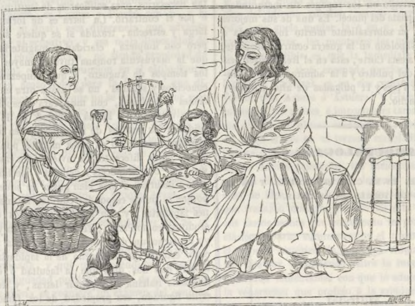
(Sacra familia.—Cuadro de Murillo.)

La felicidad, aquel bien de todos los hombres deseado, que por lo comun huye de los que con mas ansia le buscan, abandonando las córtés, los palacios, los puestos elevados, las tiendas de los guerreros, los brillantes concursos, donde rara vez se aplaude el mérito, pocas el talento, muchas el vicio, casi siempre la vanidad, suele refugiarse á las rústicas cabañas, á los humildes talleres, á las mansiones sosegadas, retiradas, ignoradas del mundo. No viste oro ni seda, no se adorna con joyas, no ciñe la espada, no empuña el baston; con modesto traje se complace en residir en medio de una familia oscura y pobre, pero honesta, enjugando el sudor del padre de familias, aliviando los afanes de la esposa, acariciando la inocencia de los hijuelos. Mas si adormecidos por los falsos placeres que ha inventado el arte en las sociedades civilizadas, dudamos de cosa tan clara y verdadera, volvamos los ojos al presente cuadro, y al contemplarle sentiremos que desterrado de nuestro corazon el bullicio de las pasiones, sucede en él la calma y la tranquilidad. ¿Y quién produce este encanto? ¿Qué nos retrata aquí el pincel de Murillo? ¿Qué vemos en este lienzo? Un aposento reducido y sin