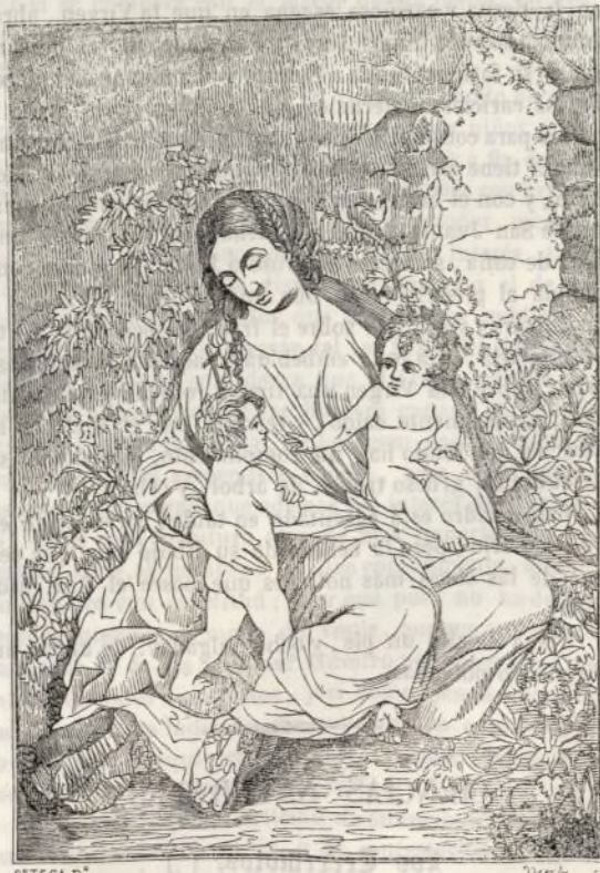
(La Virgen, el niño Jesus y S. Juan—Cuadro de Correggio.)

Los verdaderos cuadros de Correggio, son raros en todos los muscos de Europa, pues este pintor egecutó pocas obras, no solo por haber muerto jóven, sino porque puede en verdad decirse, que en cada uno de ellos