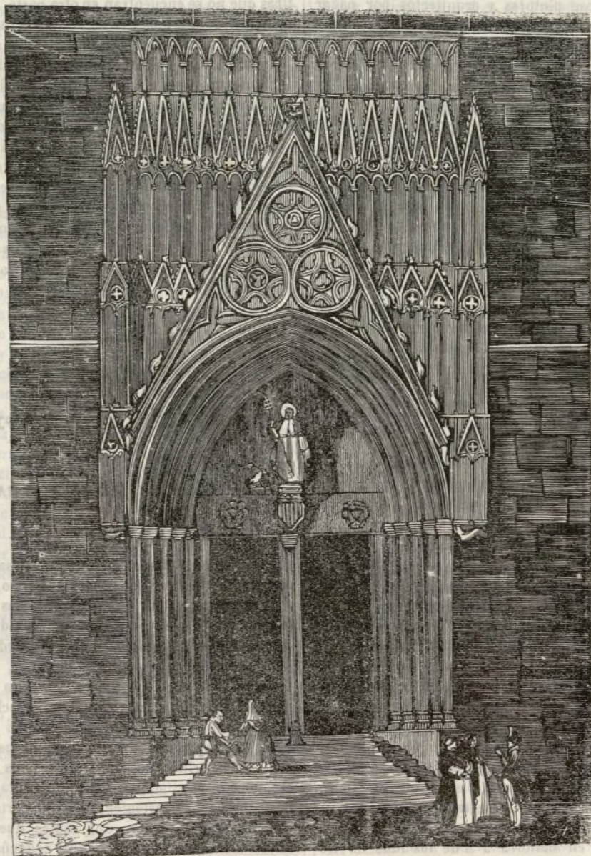
Convento de Santo Domingo de Palma.

«Hé aquí los restos de pasados días, las huellas tristes de olvidados hombres, los monumentos de apartados siglos que han fenecido.»