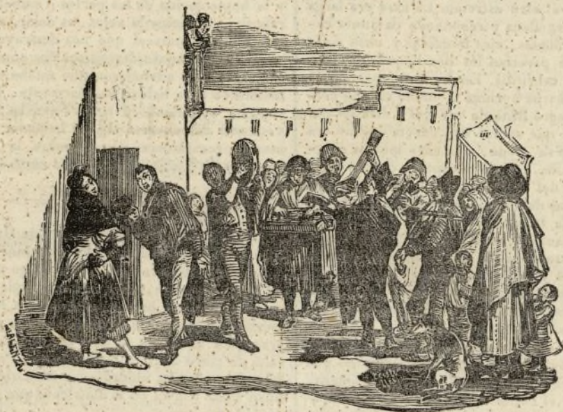
(La Jota estudiantina.)

dillas dar brincos de cólera, rasgarse los hábitos y darse mogicones contra la pared; en fin baste decir que yo tampoco pude conservar mi serenidad y rompí con un palo cuantos pucheros y cazuelas habia al rededor de la lumbre. Por resultado de todo y de no pagar la posada, salió el mesonero jurando y blasfemando, nosotros le dejamos venir, y luego que estuvo á tiro cargamos sobre el á pedradas, y tengo para mí que aquel dia no debió de tener hueso sano de tanto guijarrazo como llovimos, que como íbamos enfadados por lo de la merienda no le dejamos hasta que se metió en casa apostando que iba por la escopeta, y nosotros que ya estábamos cansados apretamos el paso y le perdimos de vista.