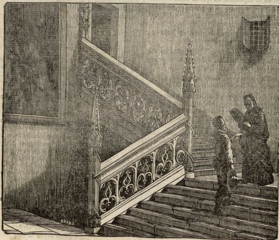
ESCALERA DEL HOSPITAL DE LA LATINA.

Un borrachon afamado supo el qué, como y manera, y exclamó absorto y pasmado: «¡que el agua faltar pudiera, á quien tanto ha bautizado!»