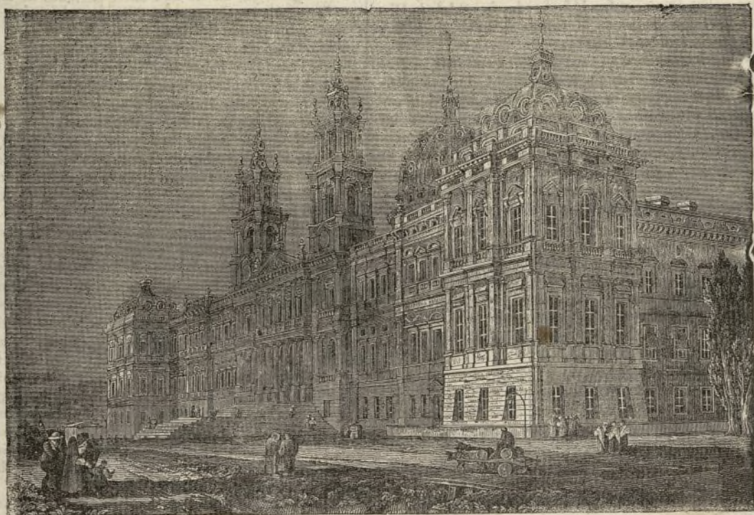
EL PALACIO DE MAFRA.

En cuatro leguas de la embocadura del Tajo, las montañas del Cintra declinan hacia el Oceano; allí se eleva con magnitud el suntuoso palacio de Mafra cuyo edificio representa el grabado.