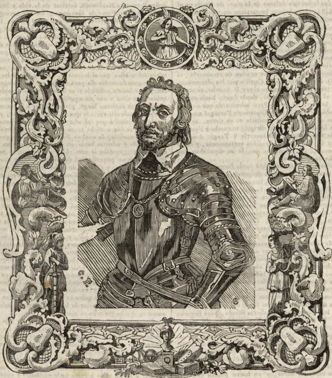
DON ALONSO PEREZ DE GUZMAN, EL BUENO (1).