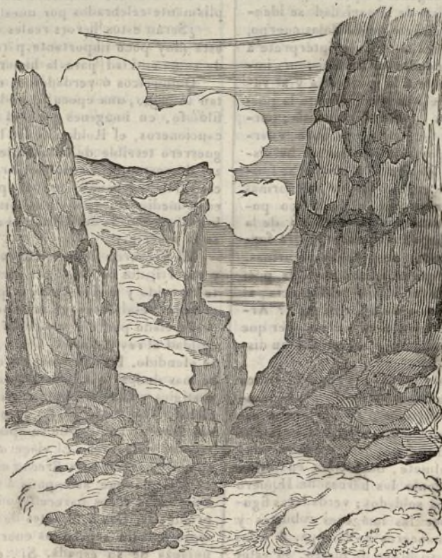
(Vista de la brecha de Roldan en los Pirineos.)

He aquí la edad media: he aquí la poesia identificada con las sensaciones. He aquí al hombre de la sociedad naciente impulsado á la vez por el sentimiento religioso y por el instinto del valor. Dirijanse estas sensaciones á un centro de utilidad comun y será el hombre de la civilizacion y de la cultura, pero sin renunciar á su tendencia física y moral por ser obra de la naturaleza.