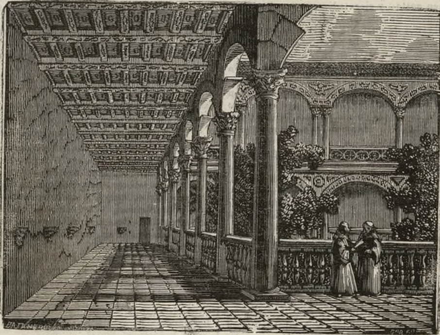
(Vista interior del claústro de Lupiana)