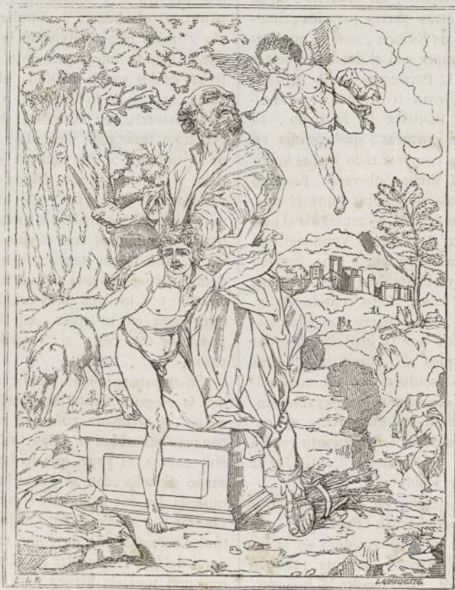
(El Sacrificio de Isaac.—Copia de Andrea del Sarto.)