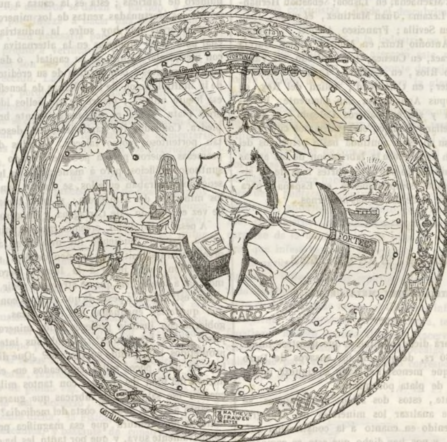
Escudo llamado de la Fortuna.

Se ignora á quien perteneció este escudo, cuya composición es muy original, y la ejecución y trabajo sorprendentes. En desquite, el nombre de su autor, Matheus Frawen Brys, es conocido, por la mención que de él se hace en la parte baja del mismo escudo; ¿pero qué país habitó este artista? ¿Era un hijo de Flandes como parece indicarlo su nombre? ¿Residió en la Península, á donde había venido para perfeccionarse en la escuela de Toledo? Esto es lo que no puede decirse de un modo positivo.