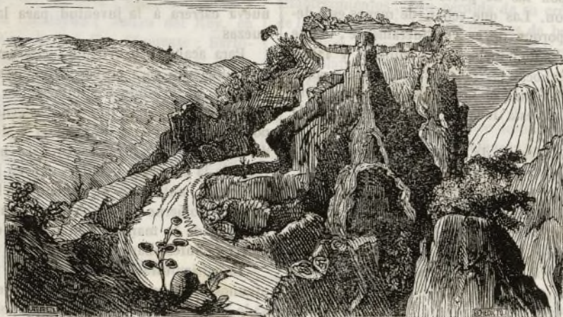
Vista y altura de la Fortificación de Mitlan.

Nuestros conquistadores del Imperio de Méjico, que dieron sorprendidos al examinar entre las obras públicas de aquel pueblo singular, las obras defensivas de diferentes categorías, que tenían las diversas naciones de aquella parte del mundo, y en las cuales se observaba grande analogía entre la forma de nuestras plazas fuertes, reductos y campos atrincherados. Todos saben que los Tlascaltecas conservaban en la estremidad oriental de su territorio una muralla construida entre dos montañas, que tenía dos leguas de estension, con un terraplen de cerca de tres varas de altura, de un grande espesor, y su correspondiente parapeto, todo construido de mampostería, con una sola entrada cubierta por dos tambores concéntricos y semicirculares.