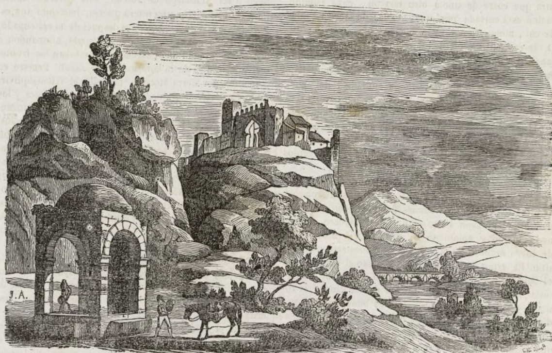
Restos antiguos de Alarcos.

Alarcos llaman nuestros cronistas a la que se llamó por los Romanos Ilarcurris , y por los Sarracenos Ilark ; y que no es en el día mas que un monton de ruinas sobre una colina, de la cual parece quieren sacar del polvo la abatida frente los monumentos que recuerdan la dominacion de entrambos imperios; por lo que este sitio es digno de fijar la atencion del curioso viajero. Se encuentra una legua distante al Este Ciudad Real que ocupa los antiguos Campos Oretanos . Por aquel flanco, la cumbre de Alarcos la que fue, es accesible por una subida algo empinada, pero llena de escombros en unos parajes, donde deja la tierra conocer el cimientto de algunos edificios, que serian notables segun lo indica la estension en otros, tal como á unos doscientos ochenta pasos antes de llegar á la cumbre una fuente, cuyo dibujo que es el que se ve en el primer término de la estampa, muestra el lujo romano, que dejó esclarecidas huellas en esta ribera izquierda del Guadiana, cuando Alarcos tenia importancia en el mundo. Al llegar á la cumbre de este pedregoso y elevado cerro, se entra por una puerta de la antigua poblacion árabe; débiles restos