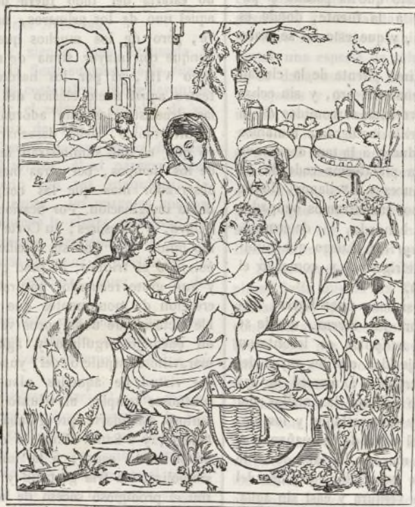
(Sacra Familia vulgarmente llamada la Perla.—Por Rafael de Urbino.)

Esta denominación no es debida, como sucede generalmente, á la representación de un objeto notable en el cuadro; viene de Felipe IV que al verlo exclamó: ¡Hé aquí la perla de mis cuadros! Se puede no adoptar enteramente la opinión del Monarca, pues este cuadro no es considerado como el mejor del Real Museo, ni como el mas precioso que haya hecho Rafael. El colorido es agradable aunque un poco oscuro; la Virgen tiene con una mano al niño, que está medio sentado sobre una de sus rodillas, teniendo la pierna izquierda apoyada en la cuna. San Juan le ofrece en su pellica varias frutas, que el niño va á tomar, mirando al mismo tiempo con sonrisa á su madre como para pedirla permiso. Esta le contempla amorosamente, y tiene el brazo izquierdo apoyado sobre la espalda de Santa Ana, que está arrodillada