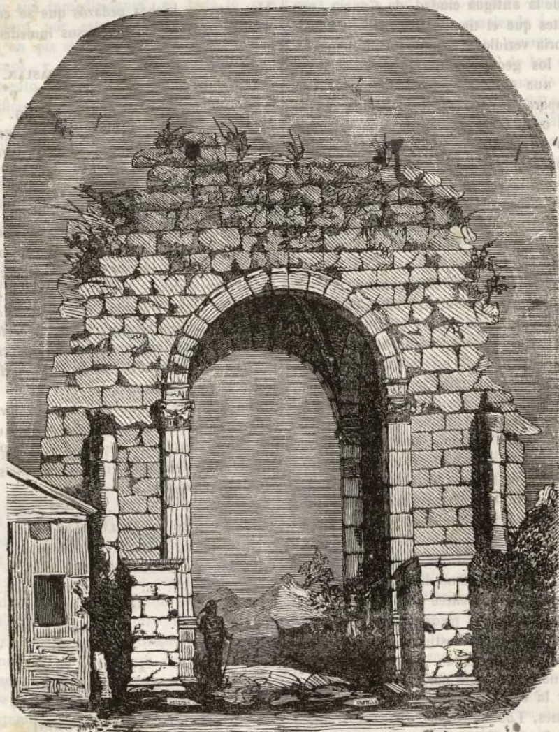
Restos de la antigua Capara, ó Caparra.

A pesar de la mordacidad jocosa, con que algunos escritores han tratado de ridiculizar el estudio de las antigüedades, es indudable que cuando este va acompañado de sana crítica, de razon ilustrada, de investigaciones profundas y detenidas, es siempre apreciado con justicia por todos los hombres de buen juicio. Es cierto que en ninguna cosa se ha delirado con tan estrordinaria prodigalidad, como en el estudio de las antigüedades: los escritores numismáticos y los anticuarios, queriendo saberlo todo, han concluido por hacer hasta cierto punto ridículo, el es-