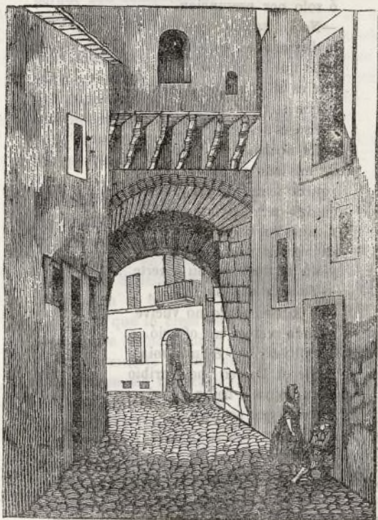
EL ARCO DE LA ALMUDAYNA.

«Ya que tanto se ha destruido, procuremos al menos hacer apreciable lo que nos queda, y reparar en lo posible los agravios que la demolición hace al arte.» ( Recuerdos y bellezas de España. )