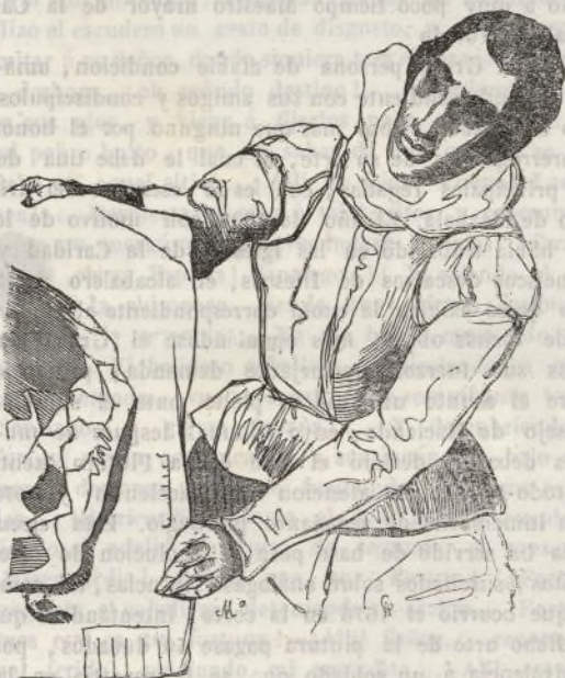
Domínico Theocópuli, vulgarmente llamado el Greco

Domínico Theotocópuli, conocido mas bien por su denominacion de Greco en los diccionarios de profesores de bellas artes, fue griego de origen (1) como lo acredita su apellido y las firmas de algunos de sus cuadros, que están en esa lengua. Señora la época de su nacimiento, solo se dice de él, pero sin datos fijos, que fue discípulo del Ticiano, quizá por la única razon de parecerse en alguna manera su estilo al de aquel célebre pintor. Las primeras noticias que de él se tienen datan de 1577, en cuyo año consta que residia en Toledo, emporio en aquella sazón del comercio y de las artes. En esta ciudad fue donde permaneció la mayor parte de su vida, y donde con su laboriosidad estremada y buen manejo del pincel, logró ser reputado como fundador de la escuela toledana, cuyo lustre en seguida conservaron sus discípulos Tristan, Orrente, Juan Bautista Maino y Blas de Prado. Los conocimientos del Greco no se limitaron solo á la pintura; fue escultor y arquitecto, y sus obras en este género participan de la sencillez y magestad de las de Herrera y Covarrubias, aunque algo mas recargadas con el ornato peculiar de la época del renacimiento. Palomino dice, que al visitarle Francisco Pacheco el 1611 le enseñó una grande alacena llena de modelos de barro que habia trabajado para sus obras de todo género, y una inmensa copia de bocetos de cuantos cuadros habia pintado hasta en-