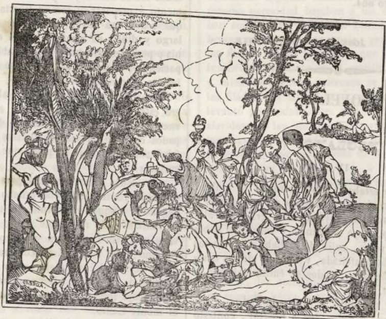
Bacanal, por el Ticiano.

Aunque en el catálogo del Real Museo se dice que este cuadro representa la venida de Baco á la isla de Naxos para consolar á Ariadna de haberla abandonado Teseo, y parece comprobarse esto mismo con el buque que á lo lejos navega viento en popa, y la figura de Sileno recostado en una alturita, no se vé en todo el cuadro señal alguna que manifieste claramente el hecho de que se trata, siendo á la verdad muy débiles los indicios por donde se conjetura. Lo que contiene, sin género de duda, es una Bacanal en país ameno, á orillas del mar; árboles frondosos con parras enlazadas le hermocean; jóvenes de ambos sexos celebrando á Baco, le auiman; brilla la alegría por todas partes; óyese el bullicio de gentes inspiradas por el Dios de las vides; aquellos hablan, estos previenen con la taza las flautas; uno bebe, otro levanta el vaso como un trofeo, varios forman danza festiva entre el concurso, toman coronas o las llevan puestas; una de las bacantes, y la mas bella de todas, se rinde al sueño: tampoco falta un gracioso niño que sin reparo hace delan-