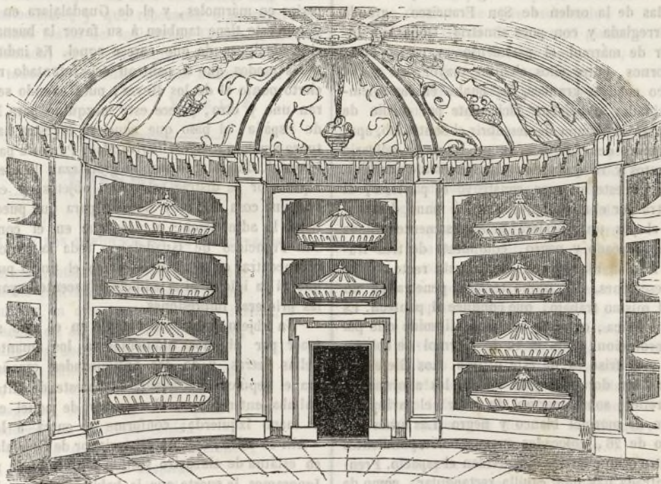
Panteon de los Duques del Infantado en Guadalajara.

En el número 32 del tomo tercero del Semanario Pintoresco perteneciente al año próximo pasado, al dar la vista y descripción del célebre palacio del Infantado en Guadalajara, ofrecimos dar igualmente las del suntuoso panteon que en la misma ciudad tiene la familia de aquel título. Hoy cumplimos por fin aquella promesa, presentando en el dibujo que precede, la vista de aquel suntuoso monumento, destrozado en gran parte por el vandalismo y el vértigo destructor que se apoderó de una gran parte de nuestros compatriotas durante la lucha civil, con mengua de la civilización y de las glorias del país que les diera el ser.