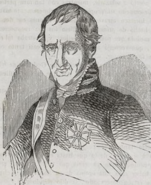
EL EXMO. SR. D. MARTIN FERNANDEZ DE NAVARRETE. (1)

Cuando paramos nuestra consideracion en las épocas que pasaron, cuando volvemos la vista hácia los hombres que fueron, un respeto y una admiracion grande se apodera de nosotros, mayormente si comparamos sus obras, sus azañas y sus escritos, con los escritos, obras y acciones de la actual generacion: ¡qué solidez, qué profundidad y qué firmeza en los primeros! ¡cuánta volubilidad, cuánta degradacion en los ultimos! Nótase este defecto mayormente en las ciencias, y en los estudios sérios que ocupaban tan constantemente á nuestros abuelos, y que hoy, merced á los prodigios de la prensa, dan escaso pábulo á los estudios de la juventud. La Europa antigua era en general menos ilustrada que la Europa moderna; pero en cambio su ilustracion, aunque reducida á un corto número de individuos, era mas sólida, mas profunda, en una palabra, mas sabia. Las revoluciones políticas, los partidos y el espíritu vivificador de la moderna Europa, han hecho escaso y reducido en nuestros dias el número de los varones distinguidos, tanto por su laboriosidad, saber y juicio, como por