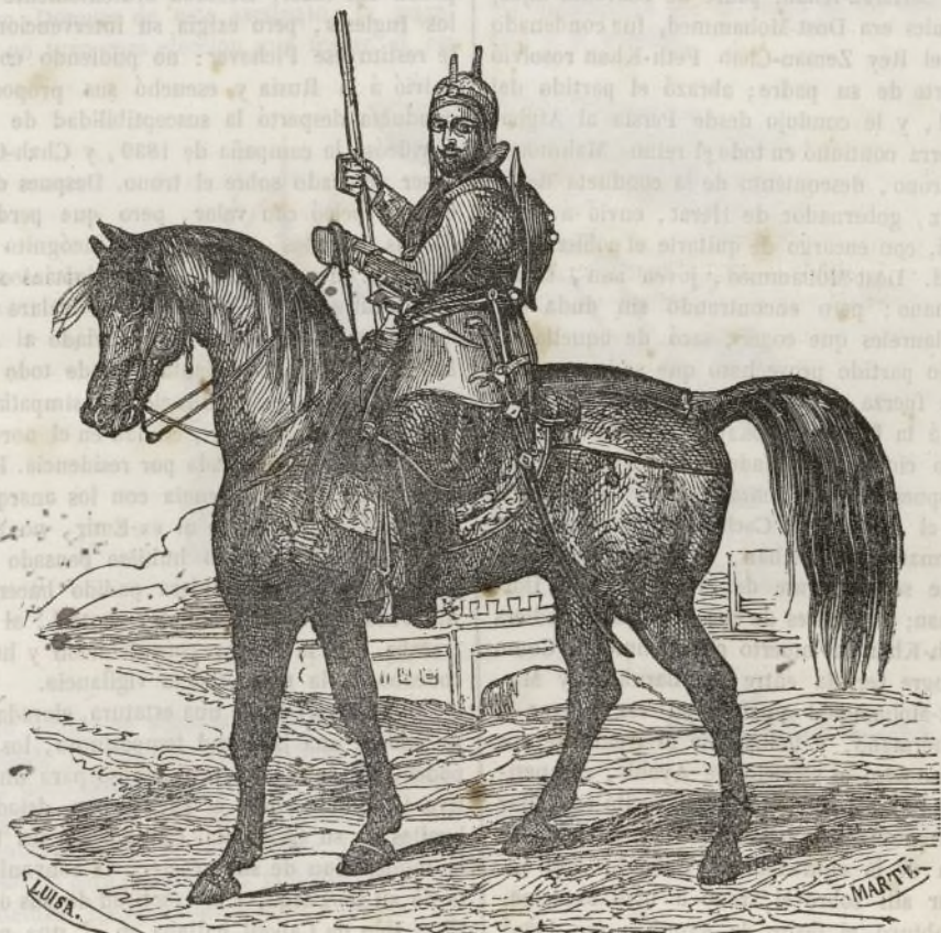
Akbar-Khan. hijo de Dost-Mohammed-Khan.

Hace dos años toda Inglaterra estaba sumida en el estupor y la ansiedad, pues eran desastrosas las noticias de la India. Una insurrección terrible había estallado en el mes de Noviembre en Caboul; muchos oficiales distinguidos acababan de ser víctimas del furor popular, y las guarniciones inglesas, arrojadas de sus puestos, perecían después de dos meses de esfuerzos y privaciones en los terribles desfiladeros que conducen del Afghanistan á la India. Podía creerse que la dominación inglesa estaba seriamente amenazada, y comprometido el gobierno en complicaciones sin fin y sacrificios incalculables. Pero después ha cambiado enteramente la situación. La Inglaterra después de haber vuelto á tomar, satisfaciendo el honor nacional, las ciudades perdidas, ha reconocido el peligro de su conquista de 1839, y se ha decidido á no mezclarse mas en las querellas de aquel pueblo anárquico é indomable: las tropas inglesas han evacuado todo el Afghanistan, despidiéndose de aquel país de un modo que contrasta singularmente con las costumbres de nuestras