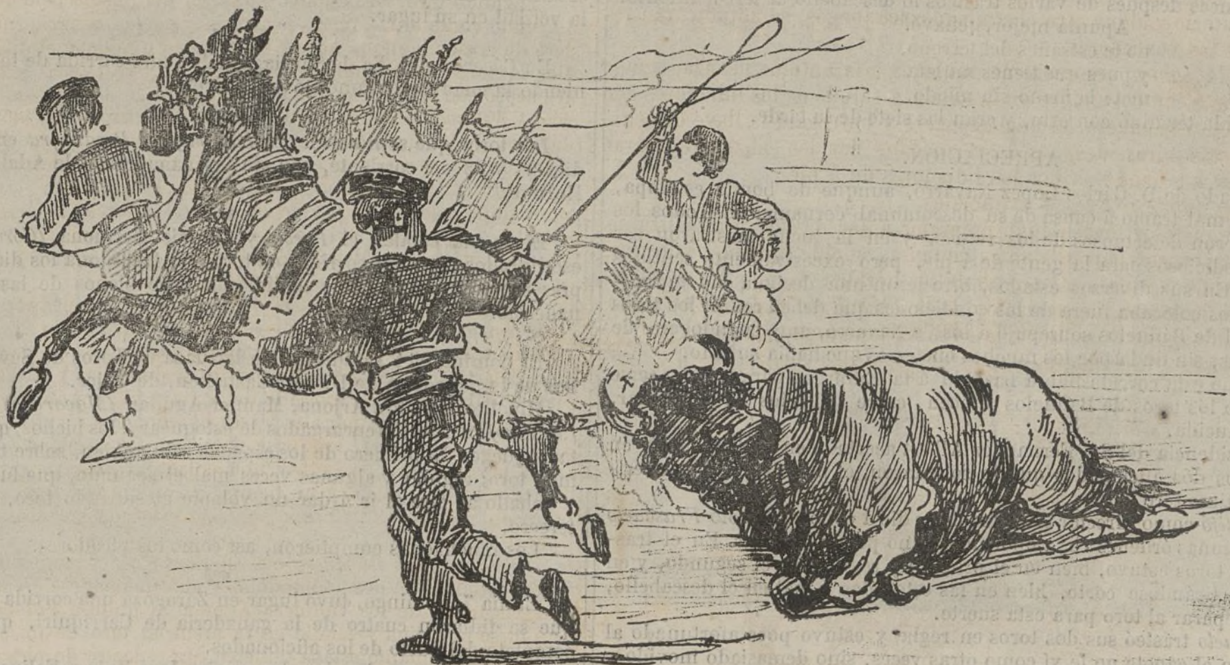
Este croquis representa tal y como aquí lo ves, el espectáculo gratis del tendido diez y seis.

puso un par de banderillas al cuarteo de rechupete y otro al sesgo muy bien. El toro trató de seguirlo por el tendido 12. Pabito, despues de una salida falsa, puso al sesgo tambien, otro par sobresaliente.