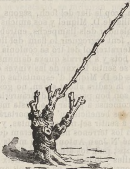
Fig. 13. Cep resultant.

Si la gelada no succehis, creyém no tocar lo sarment de precaució puig que pera favorir la vegetació de la brocada basta pinsar ó escapsar los brots del borro superior del sarment de precaució y escluirém los brots de la base de dit sarment, si re-