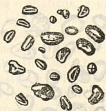
Fig. 202.—Gránuls de pésol.

Los gránuls del pésol son en general rodonejats, elíptichs ú ovóideos (figura 202); tenen los ánguls rodonejats y presentan de vegadas arrugas superficiales, en alguns casos, encare que poch, semblan soldats de dos en dos. Lo fil es poch aparent. Nostras observacions del diámetro donan 30 miléssimas de milímetre pera 'l major y 3·5 pera 'l menor. Lo Dr. Saugerres assegura que 'l major diámetro va de 36 á 43, y 'l menor de 2 á 3 miléssimas de milímetre.