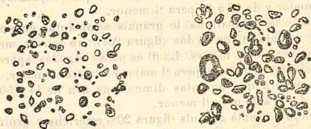
Fig. 210 — Grànuls de castanya d' Indias. Fig. 211 — Grànuls d' aglà de roure.

Nostràs observacions donan 30 milèssimas de mil·límetre al diàmetre major y 2'5 al menor. Segons lo Dr. Sauguerrès, las dimensions son en general de 18 à 30 lo major y de 8 à 13 lo menor.