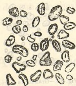
Fig. 206.—Gránuls de faba.

Los gránuls de la vessa (figura 205) son esfèrichs ó elíptichs, y tenen fil aparent. Hem trovat 23'5 miléssimas de milímetre en lo diàmetre major y 5 en lo menor; aquestas observacions molt exactas no están conformes ab las del Dr. Saugerres, qui assegura que sas dimensions son de 36 à 45 pera 'l diàmetre major y de 16 à 25 pera 'l menor.