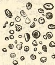
Fig. 205.—Gránuls de vessa.

Los gránuls de la vessa (figura 205) son esfèrichs ó elíptichs, y tenen fil aparent. Hem trovat 23'5 miléssimas de milímetre en lo diàmetre major y 5 en lo menor; aquestas observacions molt exactas no están conformes ab las del Dr. Saugerres, qui assegura que sas dimensions son de 36 à 45 pera 'l diàmetre major y de 16 à 25 pera 'l menor.