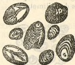
Fig. 201.—Gránuls de patata.

Los gránuls del pésol son en general rodonejats, elíptichs ú ovóideos (figura 202); tenen los ánguls rodonejats y presentan de vegadas arrugas superficiales, en alguns casos, encare que poch, semblan soldats de dos en dos. Lo fil es poch aparent. Nostras observacions del diámetro donan 30 miléssimas de milímetre pera 'l major y 3·5 pera 'l menor. Lo Dr. Saugerres assegura que 'l major diámetro va de 36 á 43, y 'l menor de 2 á 3 miléssimas de milímetre.