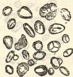
Fig. 207.—Gránuls de fabóns

Encara que los gránuls de la faba se semblin molt als prece-dents, tenen n' obstant, un aspecte particular (figura 206); son