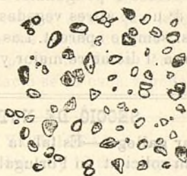
Fig. 209.—Gránuls de castanya.

Los gránuls (figura 209) de castanya son esfèrichs, ovóideos, cordiformes ó elíptichs, y en aquest últim cas semblan deprimits en sa part mitja; se presentan raras vegadas estriats, y 'l fil es poch aparent. Lo diámetro major mideix 15 miléssimas de milímetro y 5 'l menor. Segons lo Dr. Saugerres, lo diámetro máxim está compres entre 16 y 30, y lo mínim entre 8 y 13.