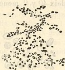
Fig. 200.—Gránuls de fajol.

deos ó triangulares (figura 201); algunas vegadas se presentan soldados los uns ab los altres. Se semblan un tant, per las estrias concéntricas que presentan, á las válvulas de las ostras. Son los majors que hem observat després dels del sagú. Lo diámetro máxim mideix fins 65, y 'l mínim unas 20 miléssimas de milímetre. Segons lo Dr Saugerres lo major diámetro oscila entre 46 y 57, y 'l menor entre 18 y 33 miléssimas de milímetre.