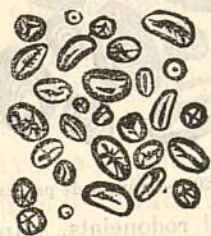
Fig. 204.—Gránuls de fasol.

Los gránuls de fasol son bastant grans, ovóideos y elíptichs (figura 204), fondament estriats. Lo fil es aparent. Son diàmetre major mideix 40 miléssimas de milímetre y 'l menor 20. Segons lo Dr. Saugerres, lo major diàmetre 'n mideix 40 y 'l menor 25 miléssimas de milímetre.