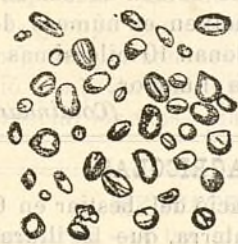
Fig. 208.—Gránuls de llentia.

La llentia presenta gránuls (figura 208) esfèrichs y ovóideos, en los quals s' hi nota pocas vegadas lo fil ó llombrigo. Nostras observacions son 20 miléssimas de milímetro pera 'l diámetro major y 10 pera 'l menor.