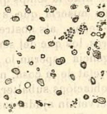
Fig. 219.—Grànuls d'arrel xirivía.

La arrel de xirivía té grànuls molt petits (figura 219), qual dimensió mitja es de 7 miléssimas de milímetre.