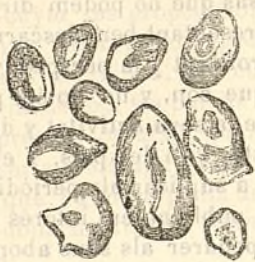
Fig. 218.—Grànuls del sagú.

elíptichs, y en aquest últim cas apareixen encorvats en un de sos extrems; lo fil está rodejat de sonas concéntricas mol caracterizadas. Son los mes grans que hem examinat. Nostres midas micro-méticas donan 90 miléssimas de milímetre máxim y 40 mínim.