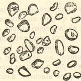
Fig. 217.—Gránuls del arrow-root.

Los gránuls del sagú son molt grans (figura 218), esfèrichs ó