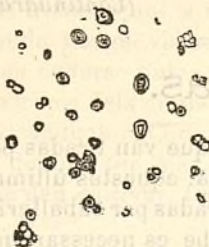
Fig. 220.—Grànuls del mill.

Los grànuls del mill (figura 220) son poliédrics, ab lo fil molt aparent Nostres midas micromètiques han donat 5 milésimas de milímetre en lo diàmetre major y 1 en lo menor.