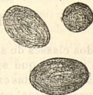
Fig. 221.—Grànuls de fécula de patata, vistos á la llum polarisada.

Los efectes de la llum polarisada son molt perceptibles quant los grànuls son bastant grossos y presentan un fil molt aparent. Tal passa ab los de la fécula de la patata, (figura 221) en los quals se fá molt visible la creu negra formada per los raigs polarisats al sortir del fil. Aquesta creu carecteristica es també molt perceptible en los grànuls de las monjetas; se distingeix també pero es molt ténue, en los de la llentia, y ja 's veu ab major dificultat en los del blat y del pèsol; no l' hem pogut observar en los del ordi, ni en los del arrós y del sagú. La observació es tan mes dificil quan mes petits son los grànuls y tenen fils menos perceptibles. La quantitat de llum absorvida per los aparatos es mes considerable á mida que l'