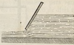
Fig. 137.—Comporta inclinada.

Lo coneixement del caudal d' aygua d' un canal ó rech pot ser