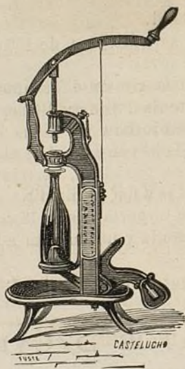
Fig. 144.—Máquina pera tapar ampollas.

La manera de funcionar un y altre es molt senzilla. Lo primer (Fig. 144) colocant la ampolla de qualsevol mida que siga, al damunt d' una especie de plata-forma sobre la qual aquella