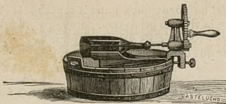
Fig. 145.—Màquina pera netejar ampollas.

la qual la ampolla està mitx ficada y ajeguda sobre un receptacle, se subjecta pel coll ab una mà, mentres l' altre dona voltas