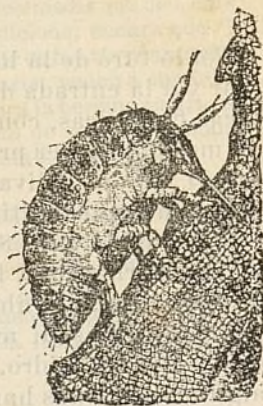
Fig. 178 Xuc-clant.

Hi ha mes encara, aquestos ceps atacats ja no tenen cabellera ni arrels grossas, quedantlosi tant sols la principal, casi despellada, mitx podrida, ab las corresponents berrugas ó protuberancias plenas de filoxeras molt vivas y perfectament desarrolladas.