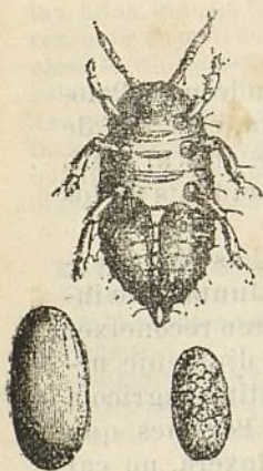
Fig. 176 Sortida del ou.

L' estat en que 's trova actualment dit insecte, ve representat de tres distintas maneras: acabat de sortir del ou, vist del davant en son complert desarrollo, de costat en lo moment d' estar xuc-clant de la arrel ab sa trompa y per últim ab alas, que tindrà d' aqui á poch temps.