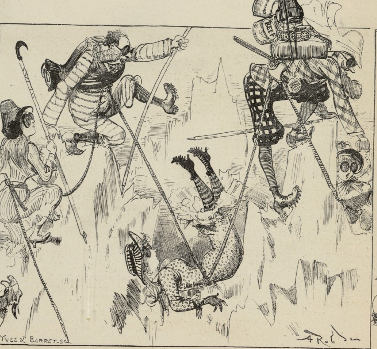
ÉCHANTILLON DE GLACIER Excursion accidentée au glacier supérieur de Grindelwald. Les 845 touristes munis de haches, de solides bâtons ferrés, de bottes à clous et de lunettes bleues, sont tous attachés à une grande corde, dont l'extrémité reste entre les mains du guide installé à l'hôtel devant un grog. Quand un touriste tombe dans une fissure, les 844 autres dégringolent ; l'agence a tout prévu : on a emporté une forte provision d'alcool camphré pour frictionner les bleus. Fitzgobler fait 14 chutes aux pieds ou sur la tête de Cleopatra Bedman.