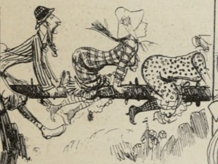
ÉCHANTILLON DE TORRENT L'agence mettant tous ses soins à procurer aux 845 touristes les émotions auxquelles ils ont droit, les fait passer sur de pittoresques ponts de torrent. Fitzgobler suit Anny Gobson d'un œil ému.