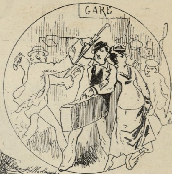
L'ARRIVÉE À LA GARE.

Ben, dis donc, Vermillon, j'ai cru que c'était la fille que je cherchais pour ma grande toile pour le salon.