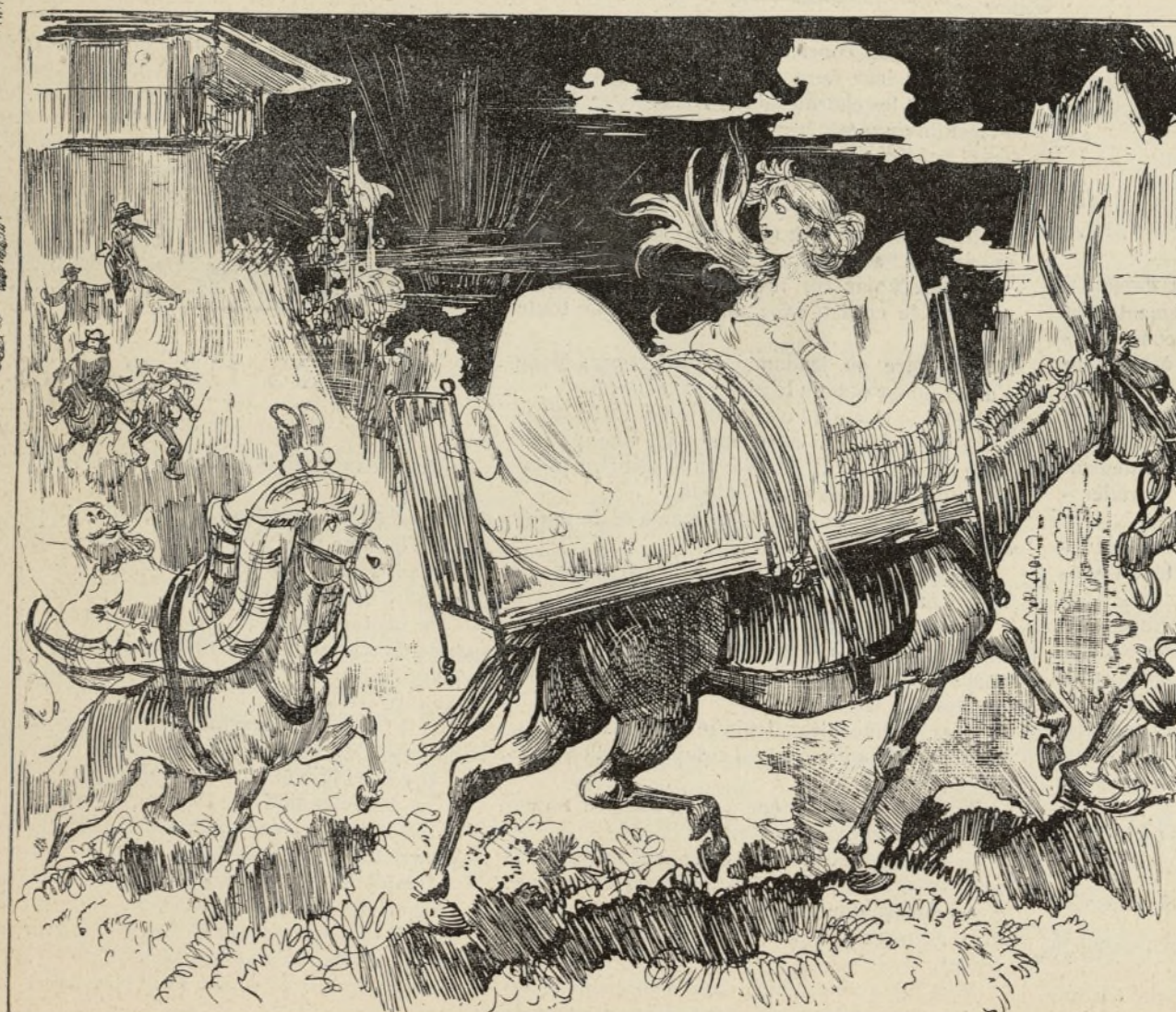
ÉCHANTILLON D'ASCENSION FACILE. — Le comble du confortable. L'agence ayant réglé d'une manière absolue les heures des départs en excursion, les touristes qui ne se réveillent pas à l'heure dite sont emmenés endormis et attachés sur des mulets, ce qui permet d'ailleurs de voyager dans des conditions de bien-être et de confortables inconnues jusqu'à ce jour. Fitzgobler admire les grâces de la paresseuse Maud Pickleson.