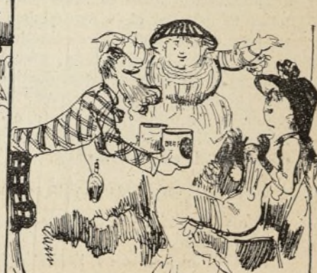
ÉCHANTILLON DE TABLE D'HÔTE Une caravane de l'agence Crogg ayant passé une heure avant la caravane Fogg, les vivres manquent ; on est allé en chercher dans la valise, c'est l'affaire de 17 petites heures ! Fitzgobler sacrifie une boîte de bœuf conservé sur l'autel de l'Amour, sauve la vie à Diana Fiddleham qui lui accorde immédiatement sa main.