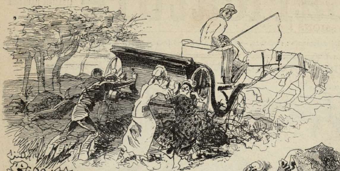
PROMENADE EN FORÊT

Hue donc!... les bourgeois, poussez fort, nous arrivons bientôt.