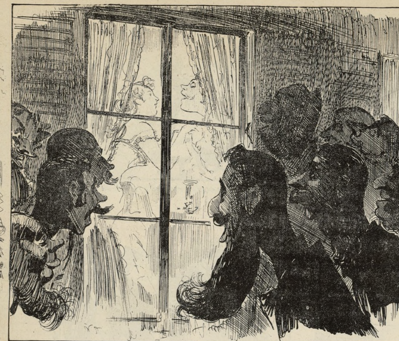
ÉCHANTILLON DE LUNE DE MIEL SE REFLÉTANT DANS LES LACS DE L'OBERSLAND L'agence Fogg accumule les agréments sous les pas de sa caravane ; profitant de l'indiscrétion des balcons d'hôtel, elle offre à ses touristes, comme distraction pendant les belles soirées, la contemplation poétique de quelque lune de miel en tournée d'excursion en Suisse. Charmant spectacle. Spécialité des hôtels de l'Obersland : chambre réservée aux voyages de nocces, belle vue sur 620 pics variés, barques sur le lac, piano, lait pur à discrétion et tranquillité pour mirer dans mes yeux les yeux. Fitzgobler pense à Lucretia Oldbury.