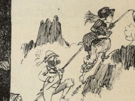
ÉCHANTILLON D'ASCENSION UN PEU RAIDE Aidez-vous les uns les autres avec l'alpinstock. Fitzgobler attend une occasion de sauver Aurélie Bugglebridge.