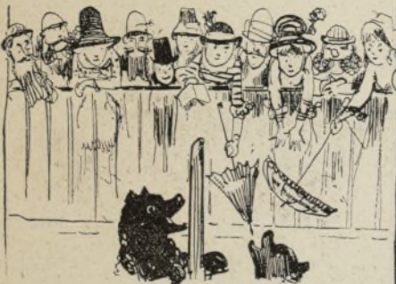
ÉCHANTILLON D'OURS Les 845 touristes apprennent avec satisfaction que les célèbres ours de Berne sont des employés en retraite, logés par la ville dans la fosse du pont de l'Aar. Fitzgobler rêve : que n'est-il ours de Berne et que n'est-elle ours avec lui !