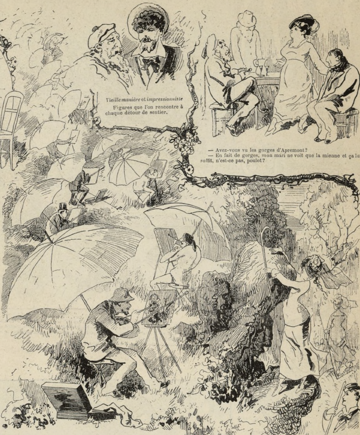
Vieille manière et impressionniste Figures que l'on rencontre à chaque détour de sentier.

« Une femme qui vous aime vous attend ce soir à sept heures. »