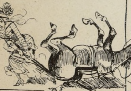
ÉCHANTILLON DE MULETS D'une docilité à toute épreuve, choisis spécialement pour les dames. Fitzgobler donne le meilleur à miss Lavinia Hislop.