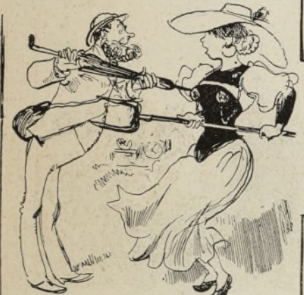
Interlaken ÉCHANTILLON DE COSTUMES NATIONAUX — Aoh ! tout était à musique, je voulais savoir si madame était à musique aussi. Fitzgobler achète une pipe à musique pour Polymnia Hitchcock.