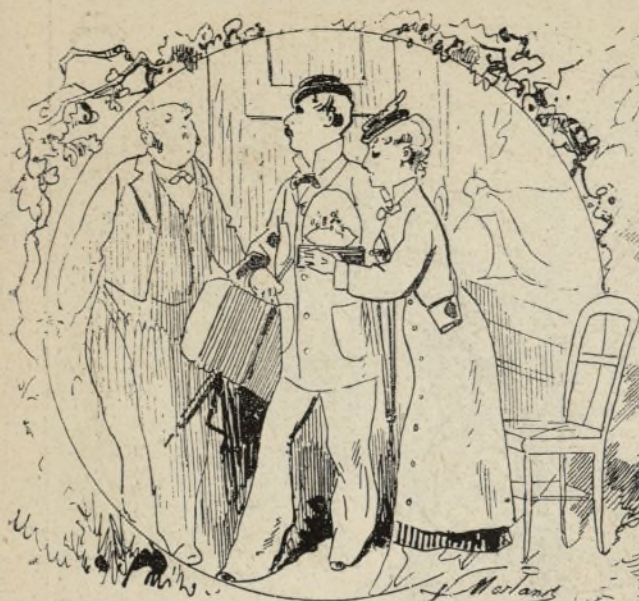
LA PREMIÈRE NUIT DE NOÛL.