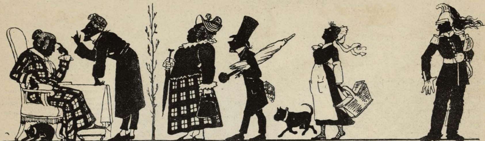
Nous donnons un grand dîner.