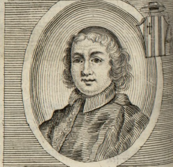
Vincentius Grimanus Abbas Venetus ~ S.R.E. Diaconus Cardinalis ~