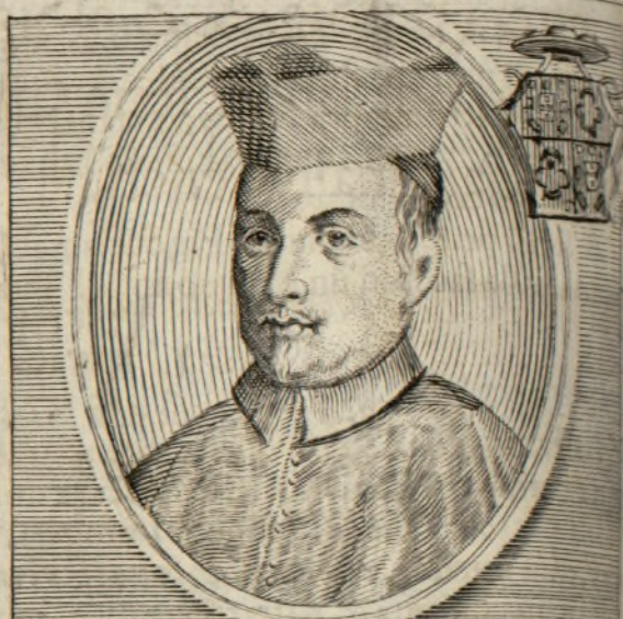
Aloysius de Sousa Lusitan Archiep Vlyssipon. S.R.E. Presb. Card. a SS.D.N. INNOCENTIO XII. in Consistorio secreto die 22 Jul. 1697 creatus