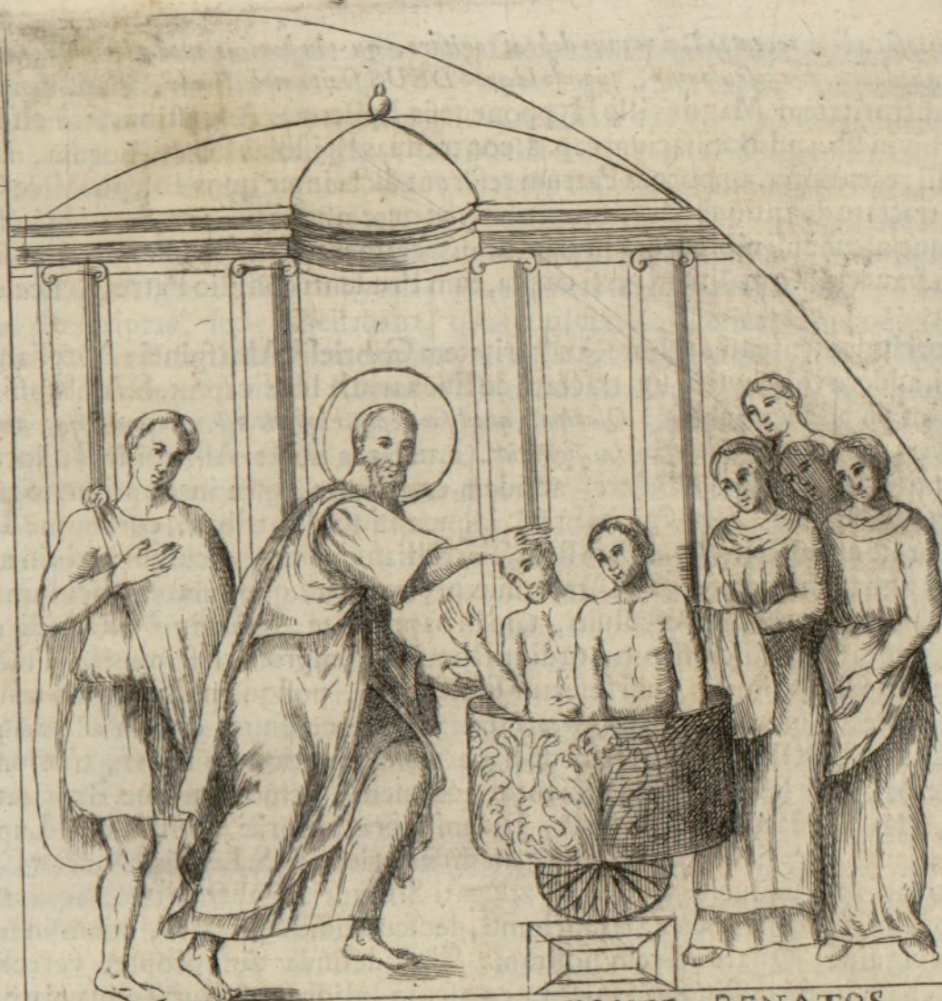
FAVXIT MACTATOS HIC VIVO FONTE RENATOS