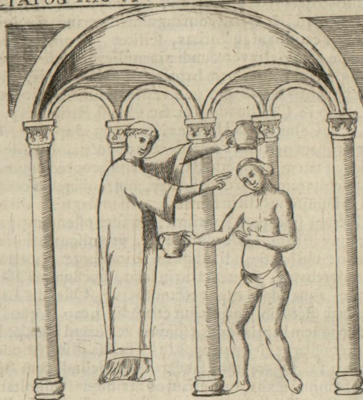
QUANDO BAPTIZAVIT BEAT ROMANVM