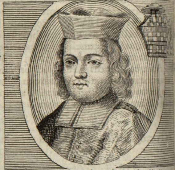
Petrus Armandus du Cambout de Coaisson Gallus. Episcopus Aurelianensis & S.R.E. Presbyter Cardinalis.