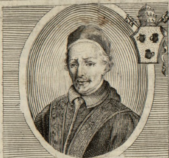
INNOCENTIUS XII. P. ON. MAX. CREATUS DIE XII II III MD C X CI ~