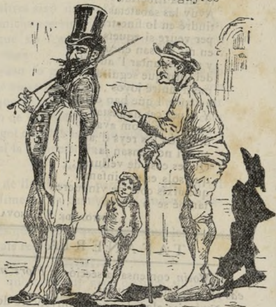
Te un rey al cos