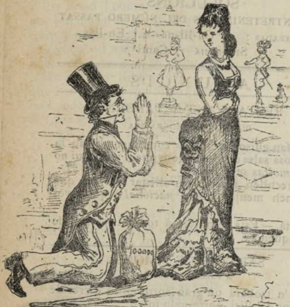
Lo rey per las xicotas