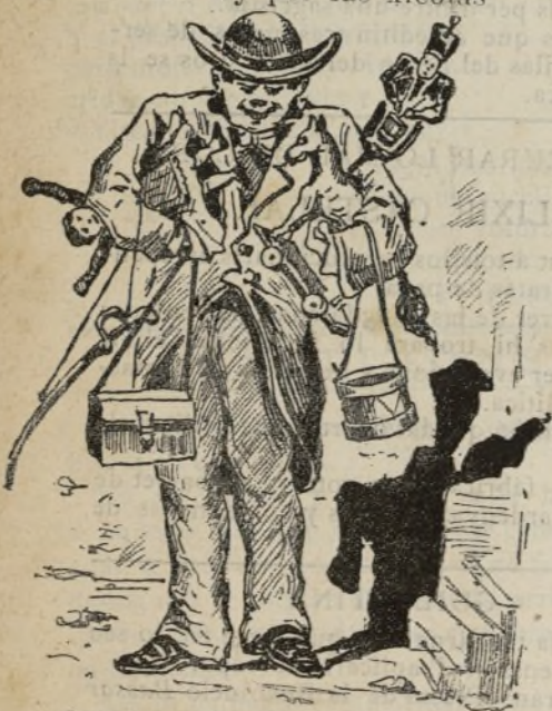
Los reys de aquestos dias