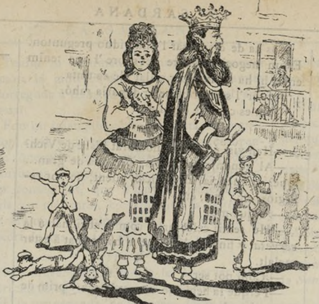
Los reys de la canalla