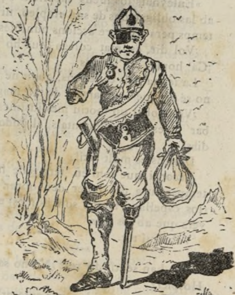
Li han portat los reys (ey l'absoluta)