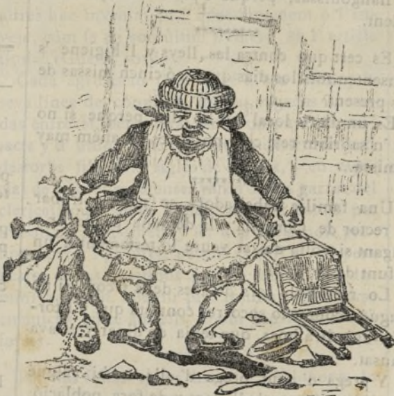
Lo rey de casa