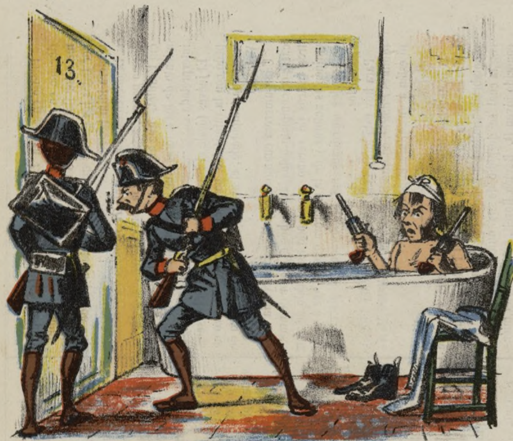
Precauciones adoptadas por algunos bañistas en las actuales circunstancias.