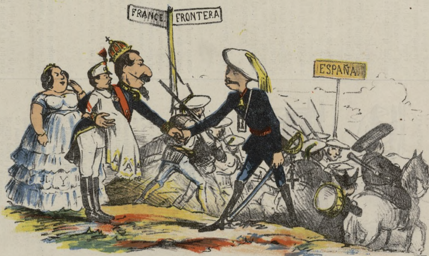
-Adios empereur , ¿quiere Vd algo para España? -Nada, niño Terso, que le vaya á Vd bien. ¡Duro, duro! que si Vd no cuaja mandaré por allá á este otro niño!