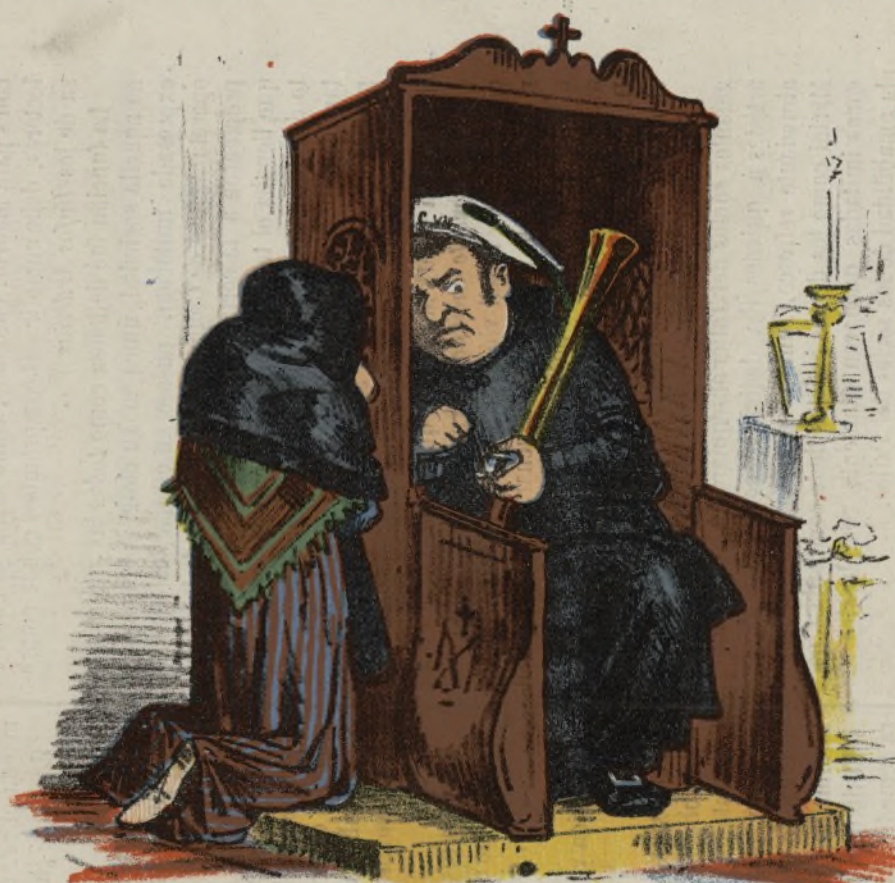
-Padre, me acuso tambien... -Despache hermana, que me aguarda la partida.