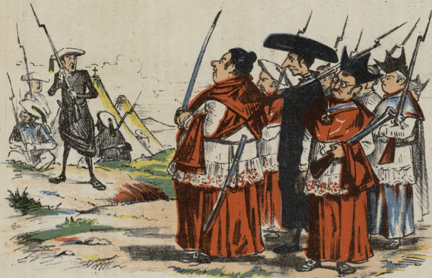
-¡Alto! ¿Quién vive? -España. -¿Que gente? -El cabildo de Astorga.