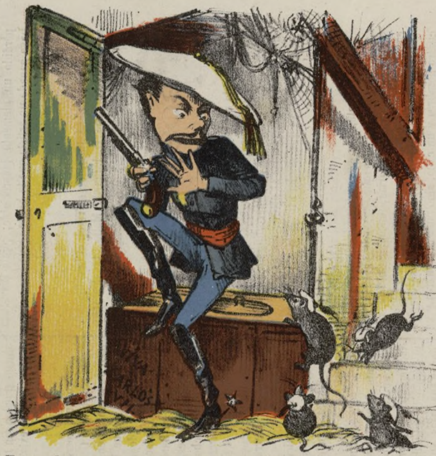
Escondrijo y actitud del Terso desde los primeros compases del movimiento carlista.