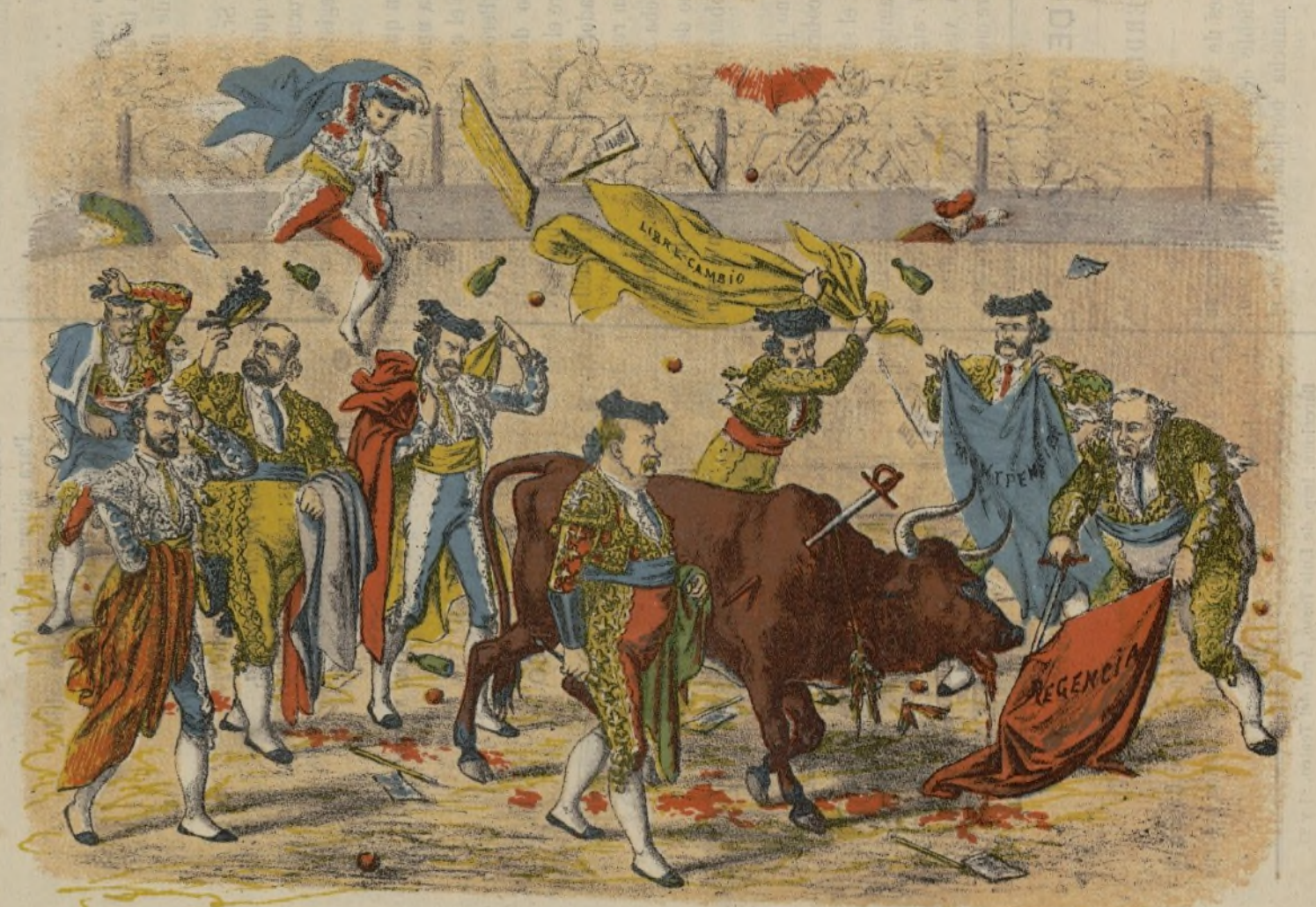
ESPAÑA.—CORRIDA DE LA REVOLUCION. Ayuntamiento de Madrid