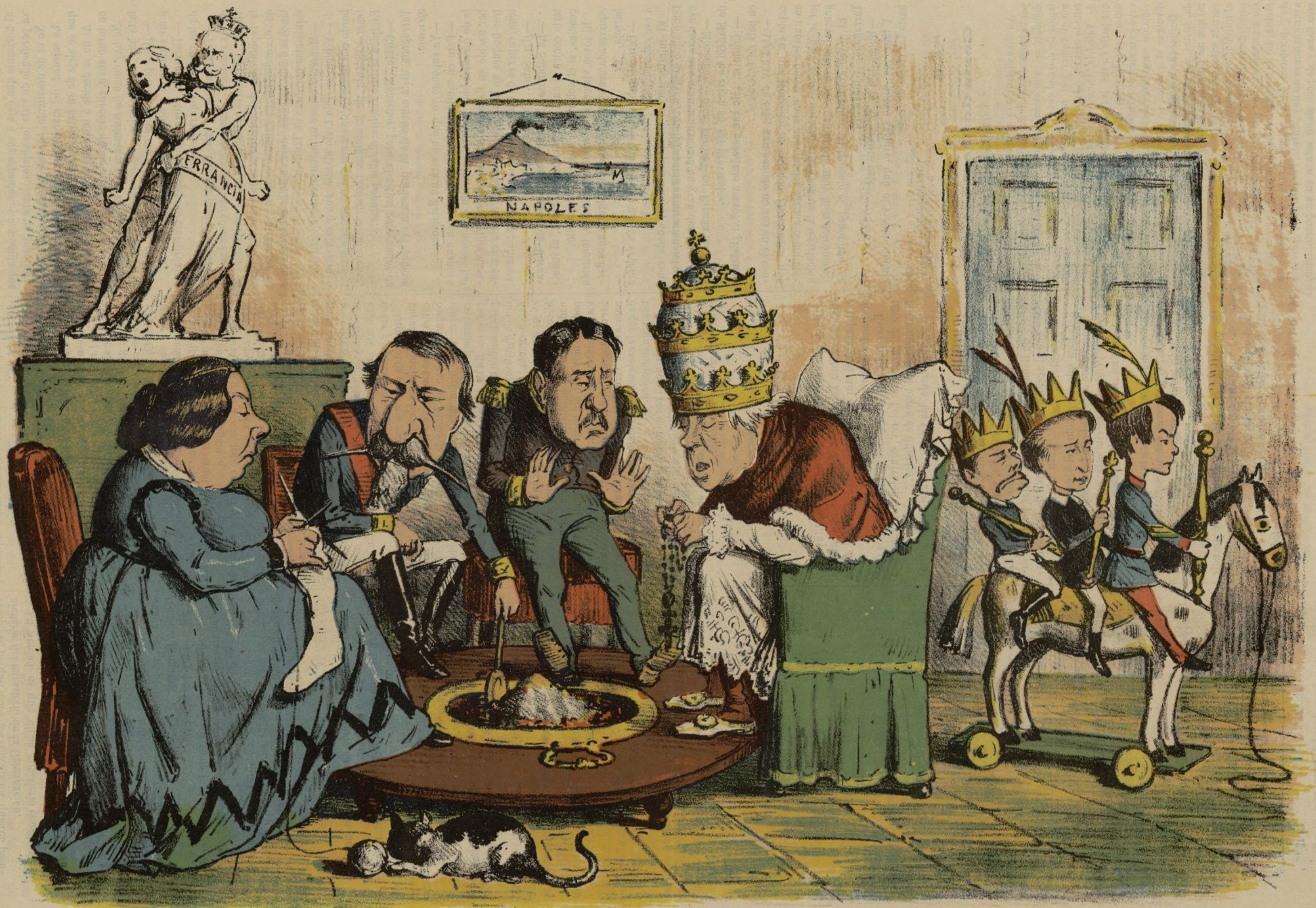
6 DE ENERO: LOS REYES. Ayuntamiento de Madrid