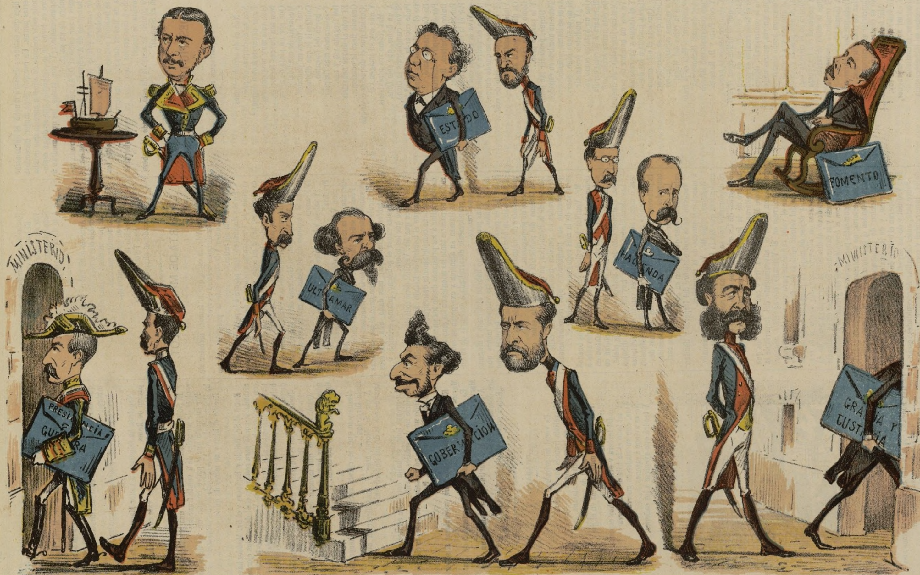
Los magyares en España. — Zarzuela conciliada. — Letra de un Romero y música de otro.