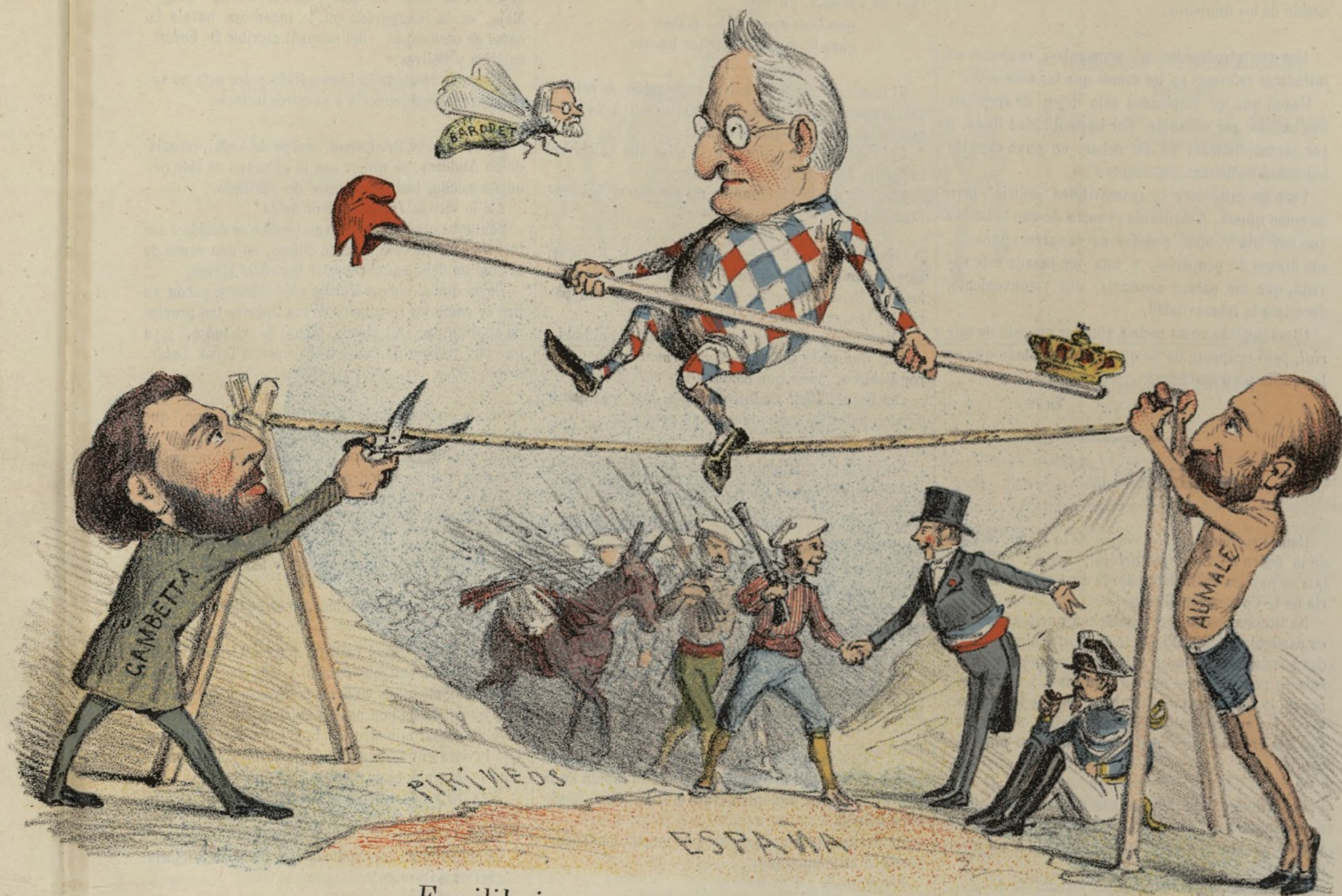
Equilibrios, trampas y peligros.