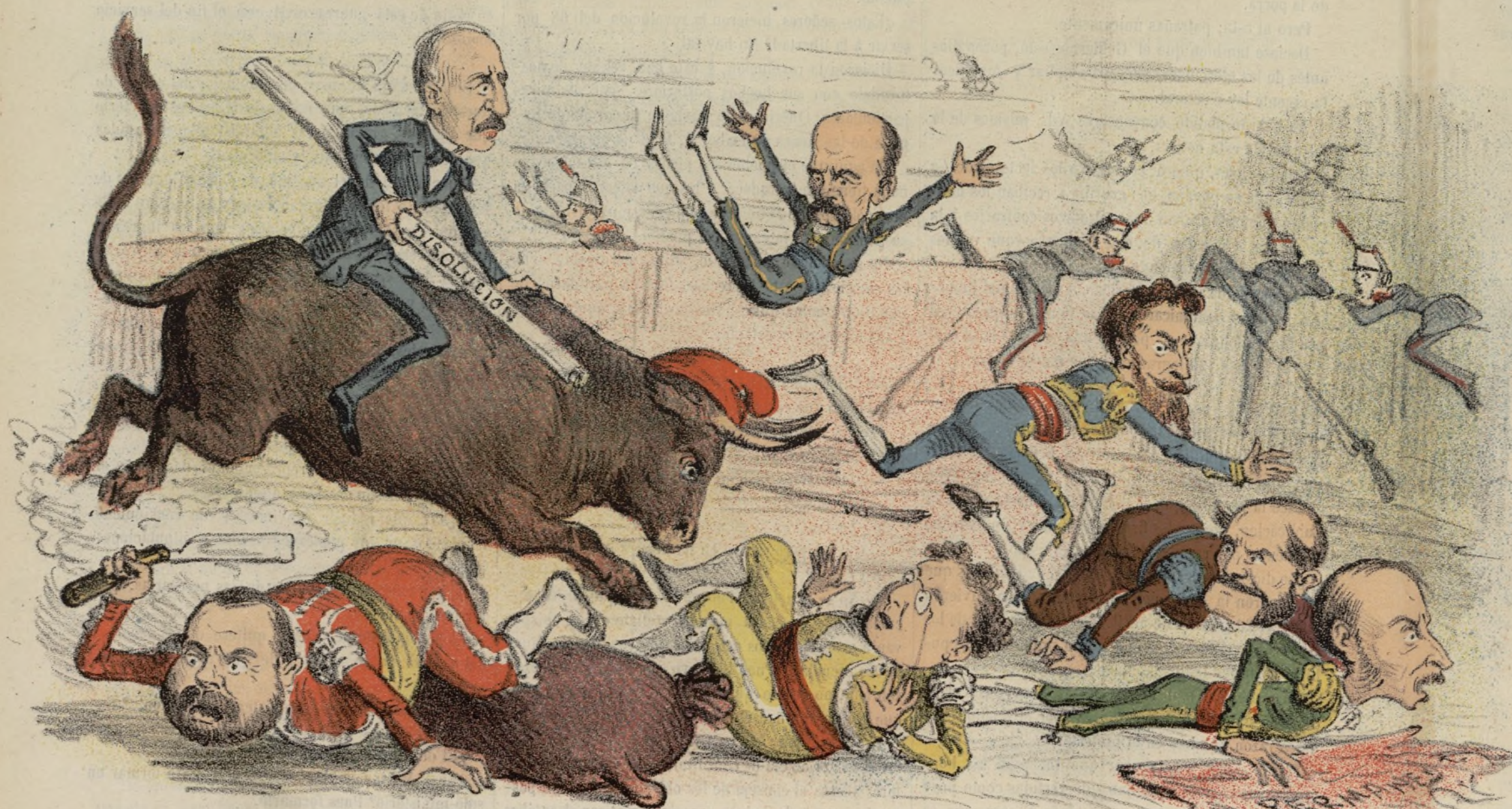
Fin de la cuadrilla.