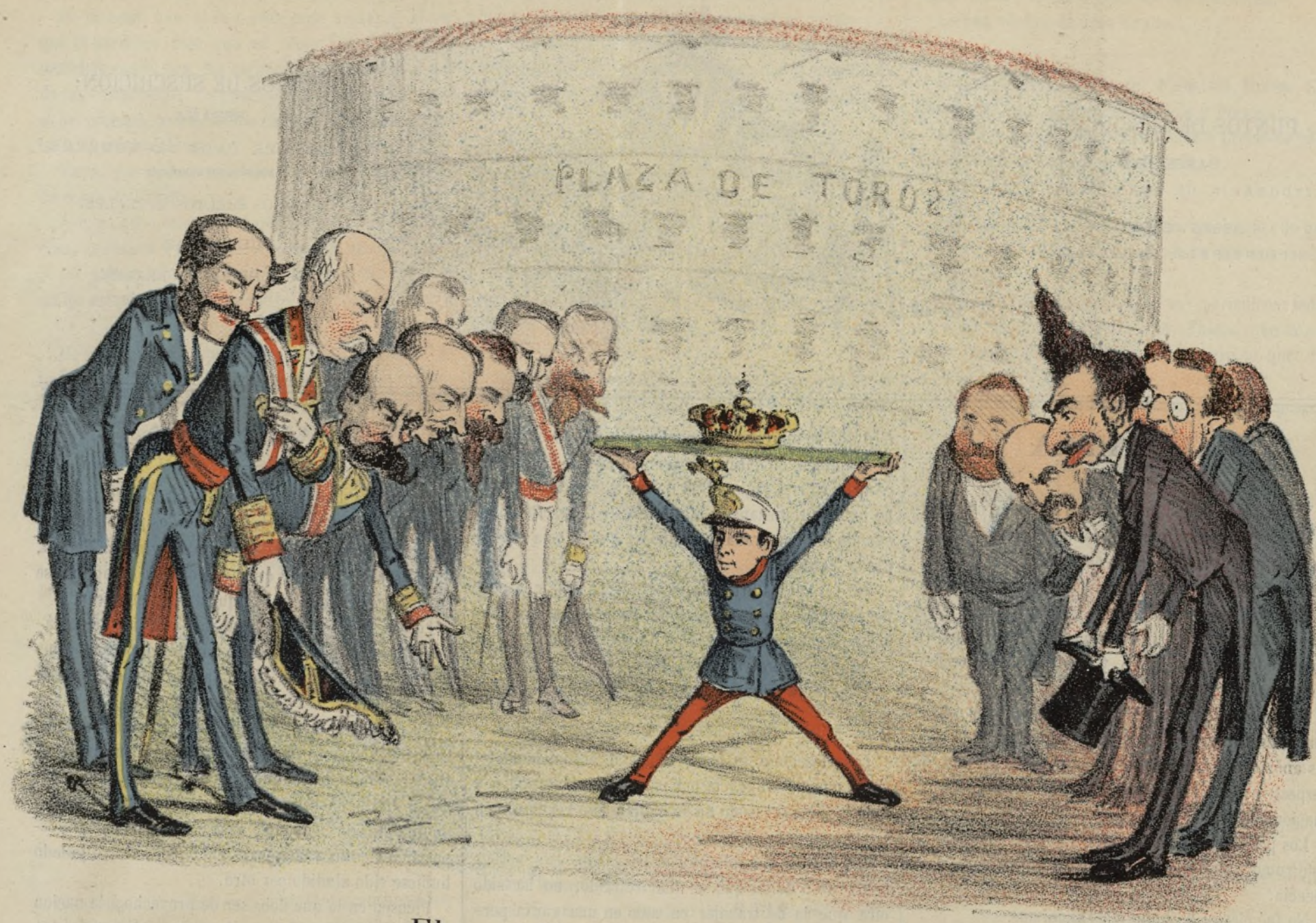
El rey X y sus adoradores.