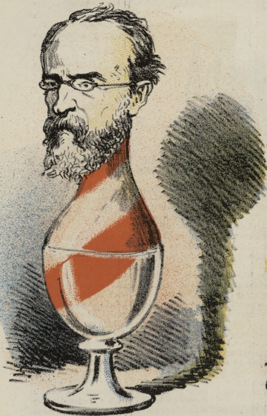
El hombre de hielo.