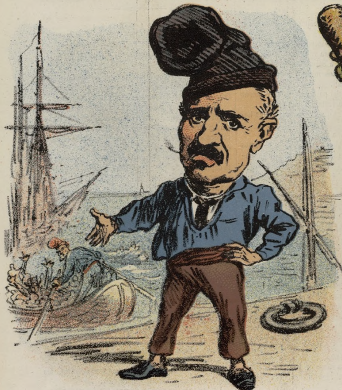
El patron araña.