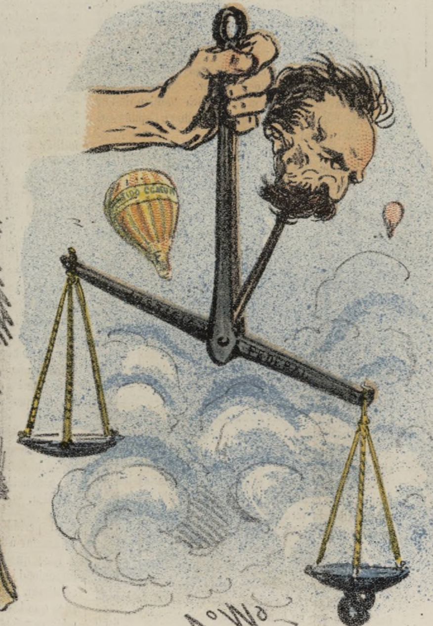
Ni Rey ni Roque.