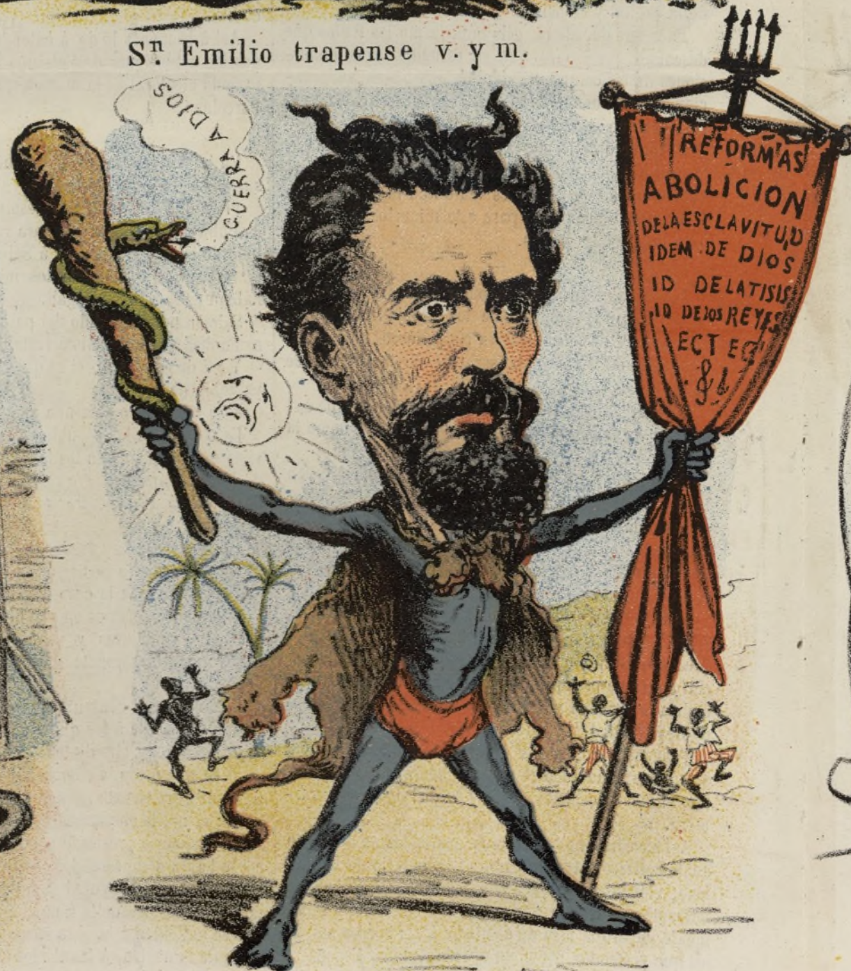
De Dios abajo ninguno y politico mas osado EL MINISTRO DE ULTRAMAR.