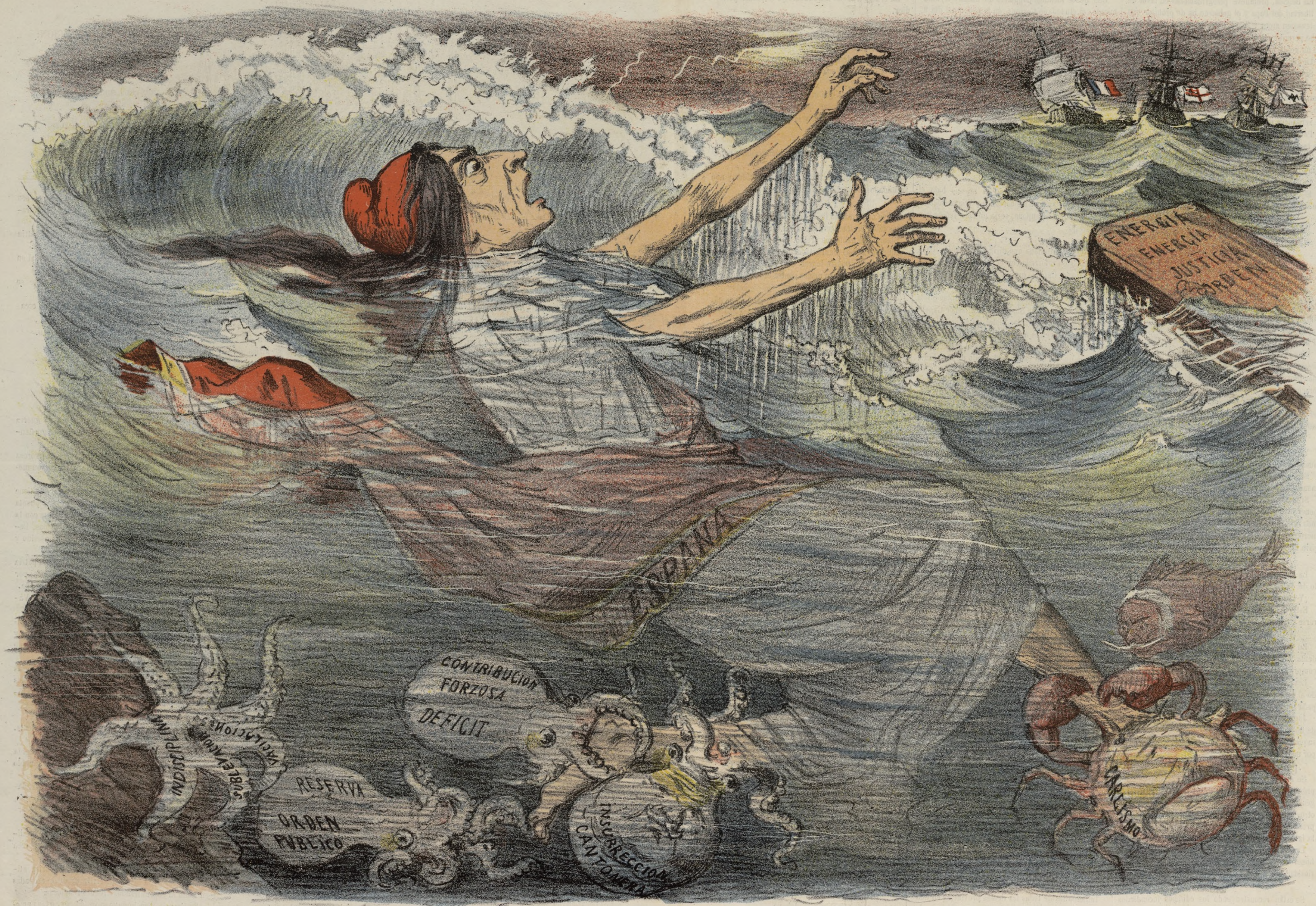
UNA SITUACION APURADA. Ayuntamiento de Madrid