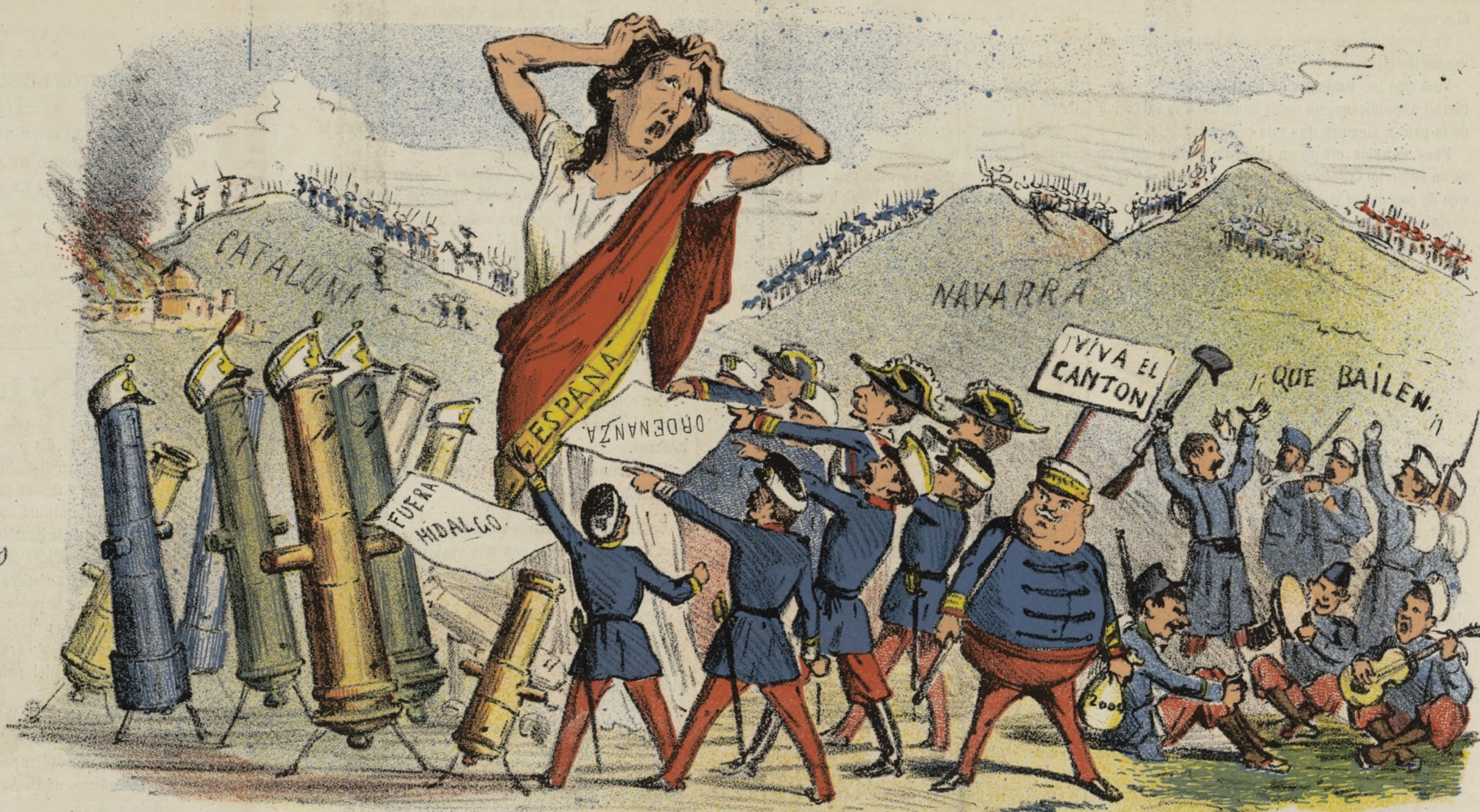
Varios problemas de difícil solución.