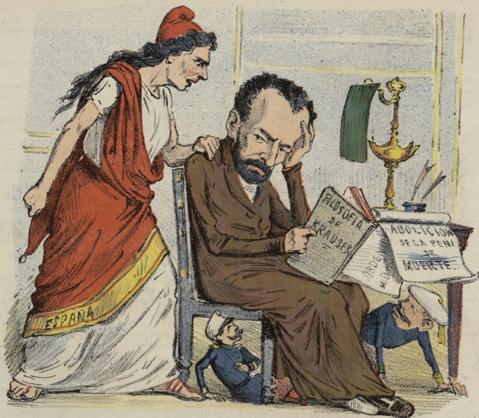
¡¡¡ Para filosofías estábamos!!! y se nos quema la casa.