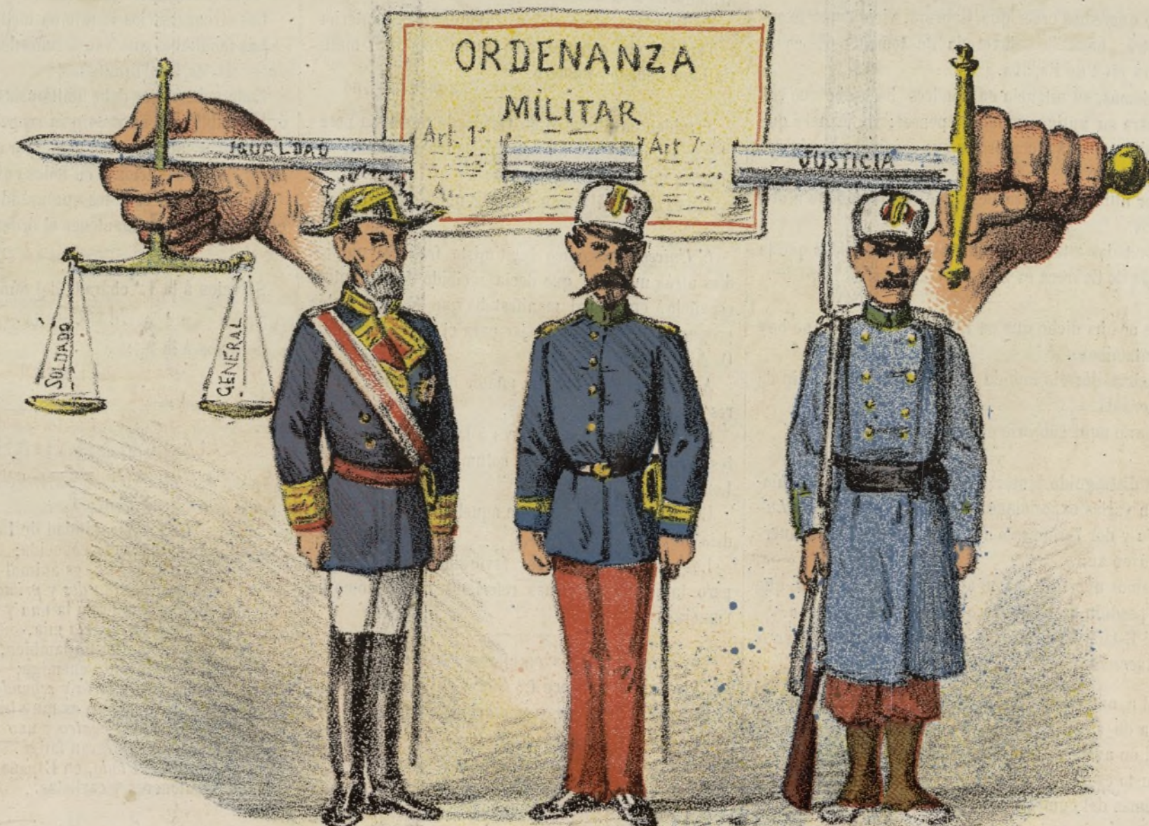
Sea igual para todos.