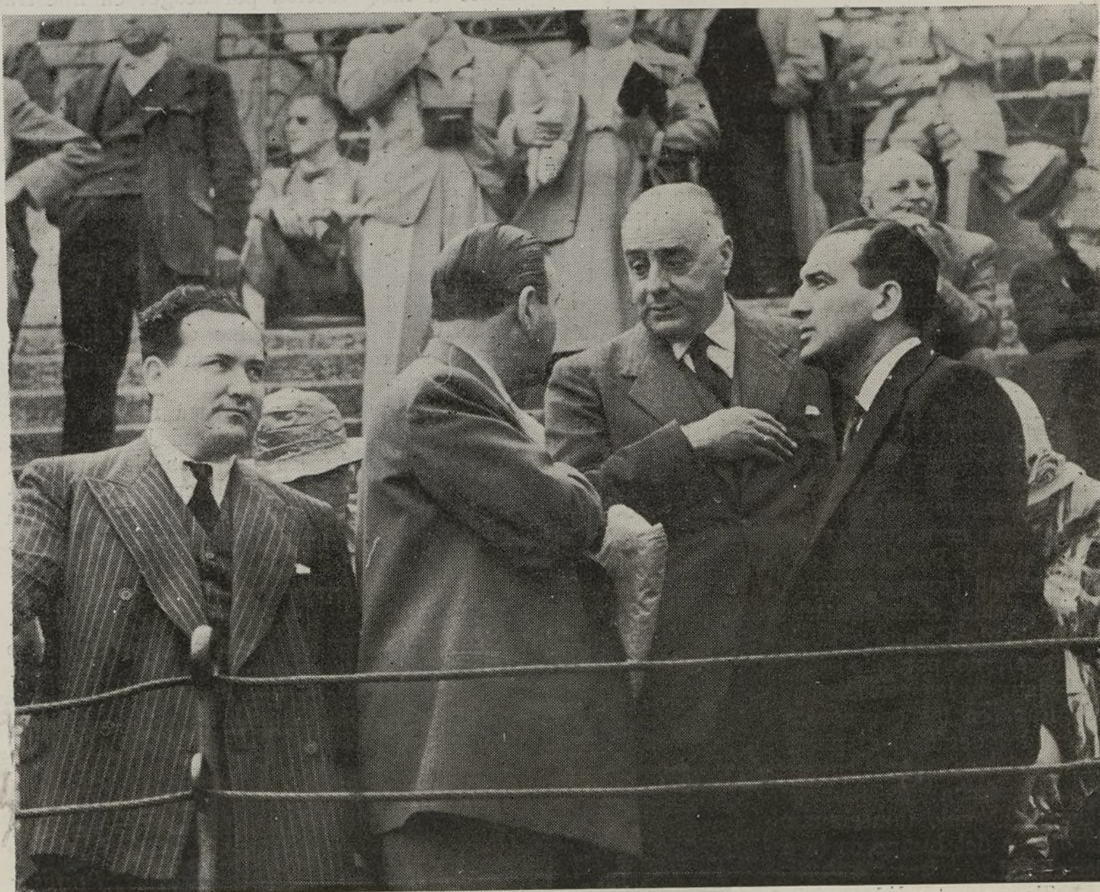
El Ministro de Educación Nacional, con el Gobernador Civil de Toledo, el Rector de la Universidad Central y el Director del Instituto de Cultura Hispánica, conversan durante un descanso del festival.