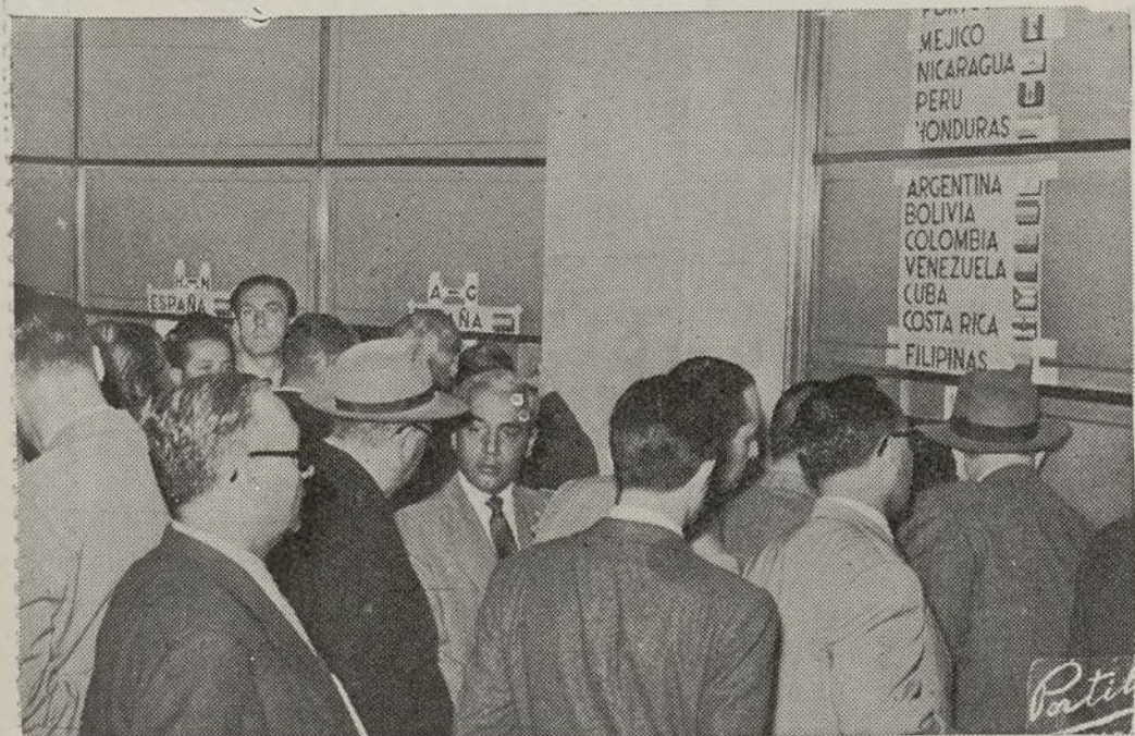
Un aspecto de la Secretaría del Congreso, durante la recepción de congresistas.