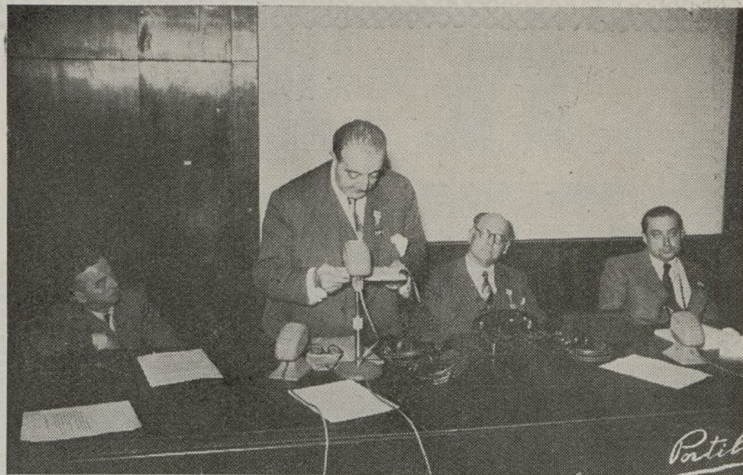
Dos aspectos de algunas de las diversas Secciones del Congreso, durante la lectura de las comunicaciones libres presentadas.

—El Capítulo Brasileño del Colegio Internacional de Cirujanos está en trance de ampliación. Promete, por tanto, adquirir en poco tiempo mucha más importancia de la que ya tiene. En la actualidad, con más de quinientos asociados, el Capítulo Brasileño ocupa, por su número, el segundo lu-