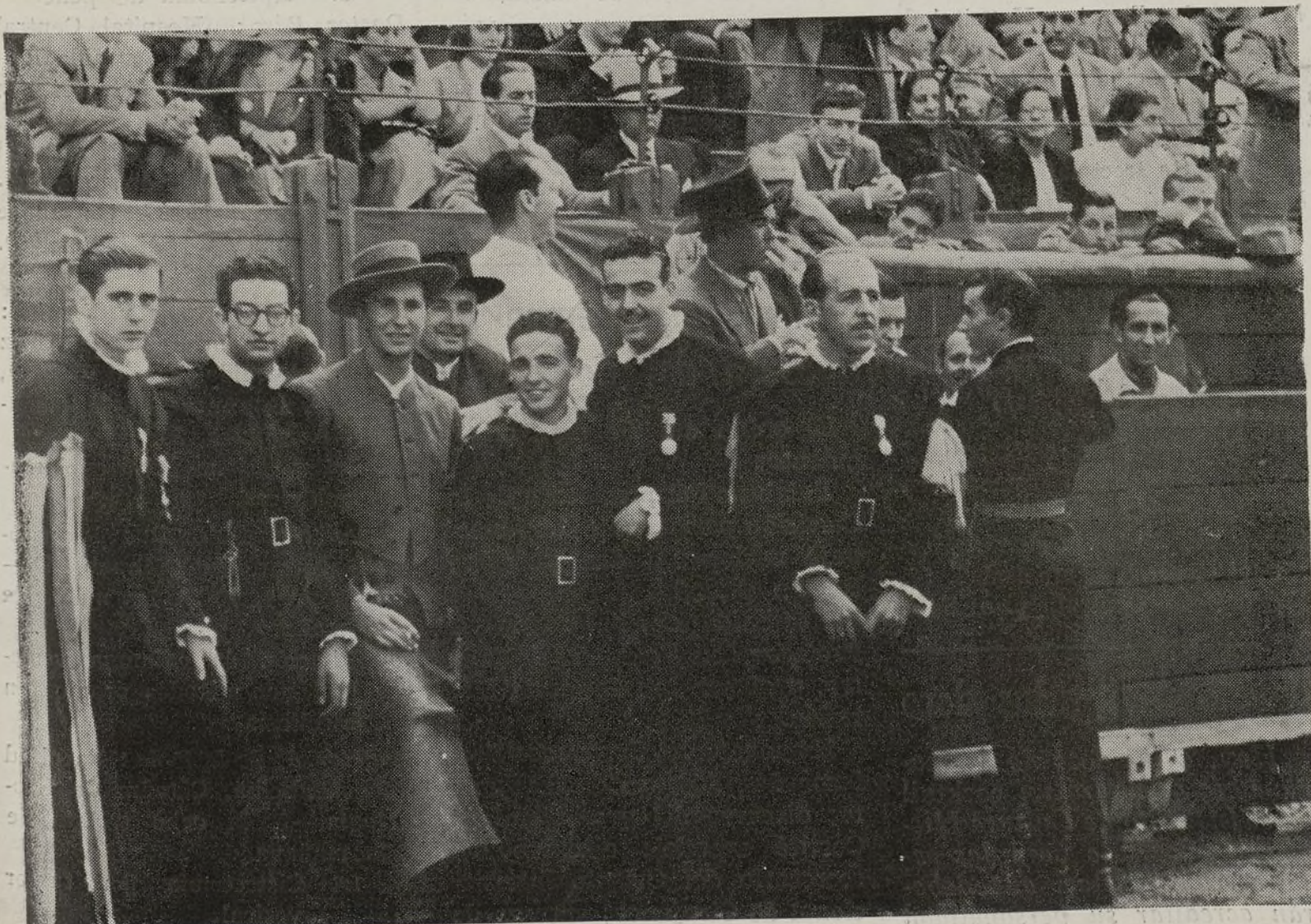
Luis Miguel Dominguín, que aquí vemos rodeado de algunos miembros de la Tuna Universitaria, tuvo una lucida actuación en el festival taurino.