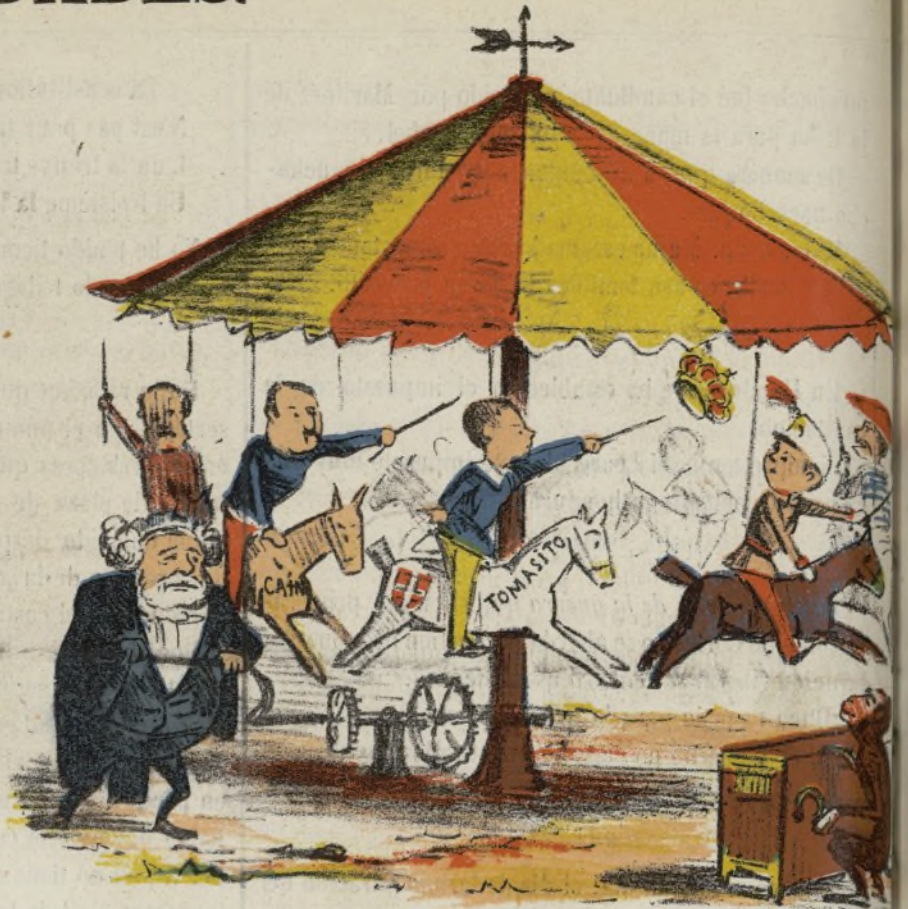
Ocios de un embajador.

—Por Dios, señores, no me pongan Vds. en el duro trance de retirarme á Vico.