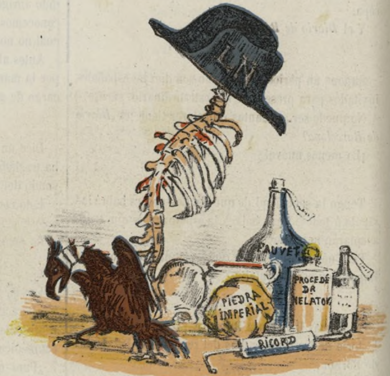
Causas de aquellos efectos.