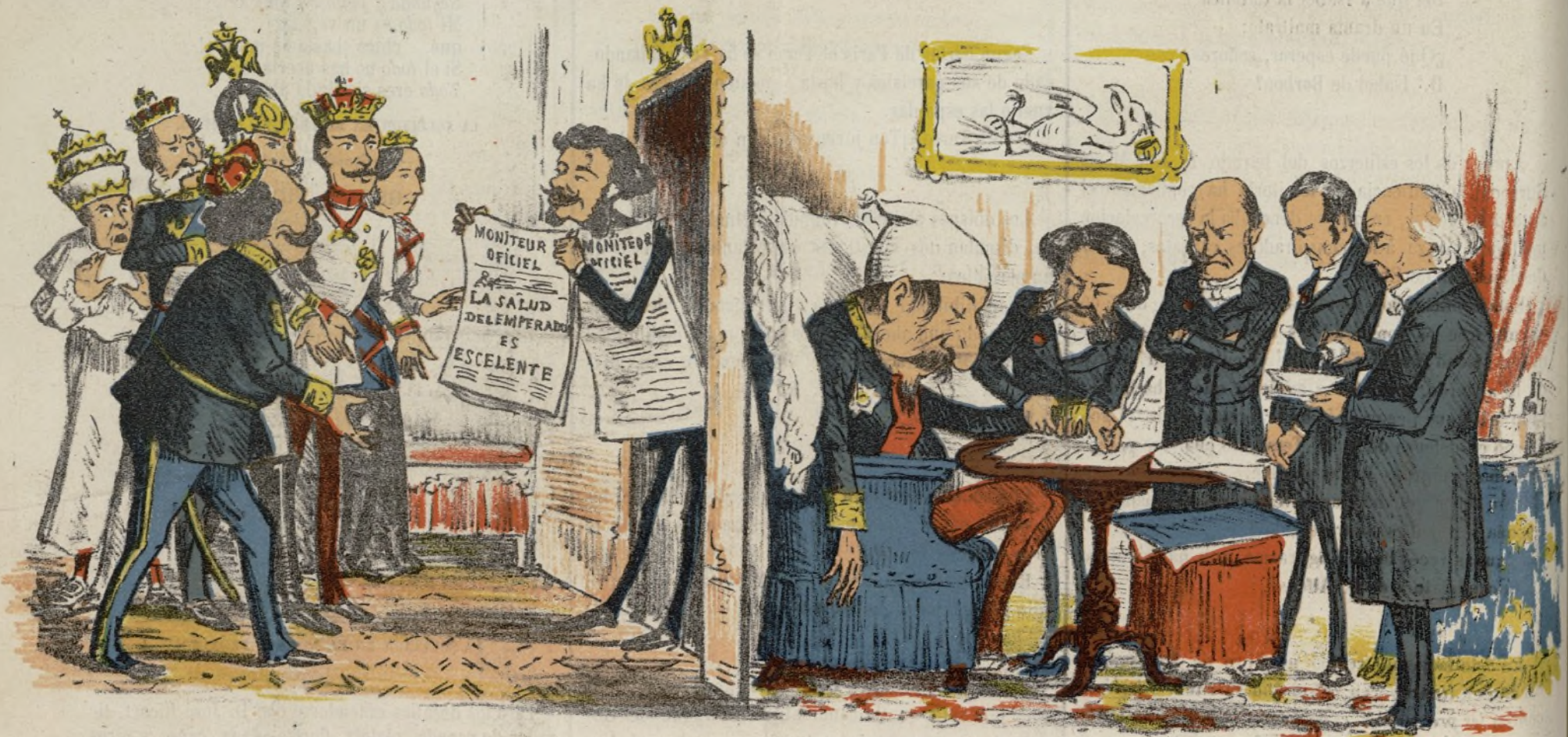
DESDE LAS BUTACAS.